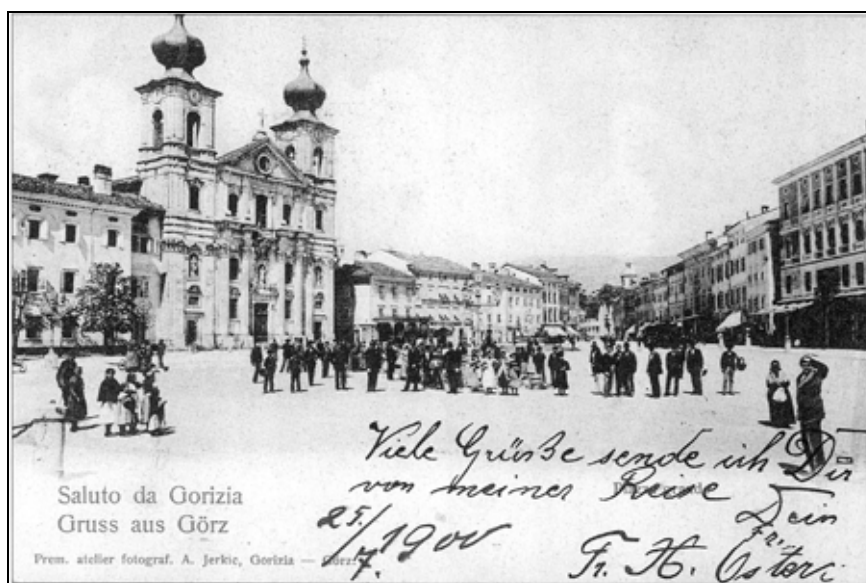
Trg Travnik v Gorici, kjer je živel Carlo Michelstaedter (ok. 1900) (Jerkič, Pozdrav iz..., str. 59).

pravljena prva razstava njegovih umetniških del. 14 V Gorici sorazmerno redno potekajo znanstvena srečanja o njegovem delu in njem samem. Kulturne ustanove in samostojni pisci pišejo dela o njem in omogočajo ponatise njegovih del, pri tem pa finančno pomagajo tudi lokalne oblasti (goriška občina in pokrajina) in ustanove. Nekatera njegova umetniška dela so razstavljeni v goriški sinagogi v okviru stalne razstave o goriški judovski skupnosti. Mesto Gorica je po njem poimenovalo tudi eno od ulic.