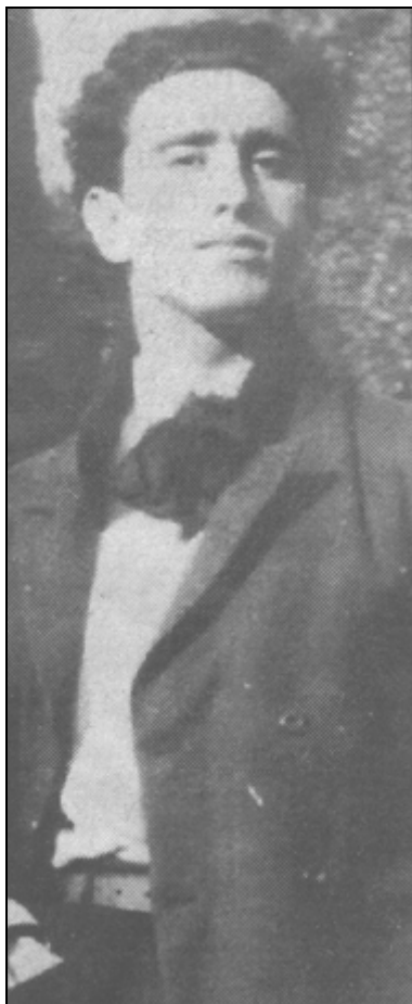
Carlo Michelstaedter ( Il Piccolo , 31. december 1996, str. 3).

Bil je zelo eruptivnega značaja z velikimi in skrajnimi spremembami razpoloženja, pri delu je bil hiperproduktiven. Veliko je pisal, se ukvarjal s številnimi športi, v zelo kratkem času je zmožal prebrati zelo veliko, poleg tega pa je bil še dober študent.