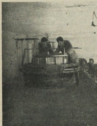
Nove stroje iz Norveške sta montirala naša strokovnjaka.

O priliki obiska v tovarni mi je prišel v roke tudi tovarniški list »Konoplan«. Ko sem listal po njem, sem videl, kako se odvija en del življenja delovnega kolektiva tovarne.