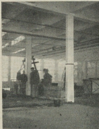
Zadnji meter ksilolitnih tal polagajo v novi predilnici.

sije, kot je odprava nočnega dela žena-mater, kateremu vzrok so ozka grla v premajhnih kapacitetah naših predilnic do tkalnic, moral republiški odbor še nadalje reševati z merodajnimi forumi za njih odstranitev in tako tudi samo odpravo nočnega dela.