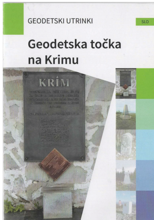
Slika 4: Naslovna stran prve brošure iz zbirke Geodetski utrinki. Izdajo brošure je omogočila Geodetska uprava Republike Slovenije (vir: GIS, 2022).