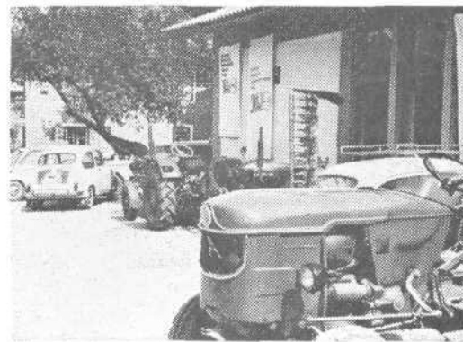
Takle je bil parkirni prostor v Vodica, traktorji in nekaj fičkov

DA VODICE niso ravno med najbolj revnimi vasi, to smo že slišali, tudi to, da je njihova živinoreja na zavidljivi ravni. Toda, ko smo pred vaško gostilno na glavnem trgu zagledali kakih trideset traktorjev, ki so se gnetli med fički in drugimi civilnimi vozili, pa nam le ni šlo v račun. Kaj, da bi imeli v Vodica zaradi traktorjev že stisko s parkirnimi prostori, nak, to zveni pa že malce boso.