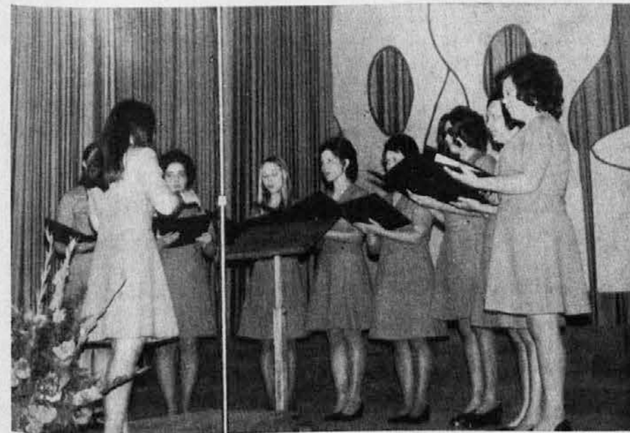
Dekliški oktet pri »Cecilijanki 1972« v Katoliškem domu

Nedelja: 8.55 Mestece Peyton. 10.35 Po domače z Dobrimi znanci. 11.00 Otroška matineja. 12.55 St. Moritz: Smak za moške. 14.00 Ljudje in zemlja. 15.00 Umetnostno drsanje. 17.45 Za konec tedno. 18.05 Velika balonska dogodivščina - film. 18.55 Gonja. Ponedeljek: 17.45 Zvonček palček. 18.30 Gvajana. 20.30 Z. Dimbach: Harmonika. Drama. 21.35 Po sledih napredka. Torek: 17.45 Deklica z »Zigalicami«. 19.05 Prehrana dojenčkov. 19.25 S kamero po svetu: Cleveland. 20.35 Diagonale. 21.25 Stoletje kirurgije. Sreda: 17.15 Mačkon in njegov trop. 17.55 Košarka C. Zvezda: Simmenthal. 19.30 Kratak film. 20.30 Kosilo v travi - film. 21.05 Nogomet Škotska: Anglija. Četrtek: 17.45 »Jurček«. 18.30 Druščina Jehu. 18.55 Poljudno znanstveni film. 20.25 Karn in kako na oddih. 20.40 Četrtkovi razgledi. 21.30 Na valovih Mure. 22.00 Balet. Petek: 17.45 Pilot in letalo. 18.30 Profesor Baltazar. 18.40 Vzgojni problemi. 18.50 Pet minut za boljši jezik. 19.00 400 let slov. glasbe. 20.30 A. Moravia: Rimljani. 22.05 XXI. stoletje - film. Sobota: 15.45 Alpsko smučanje. 16.30 Košarka Olimpija: Radnički. 18.15 Maroška - češki film. 18.45 Filmska burleska. 21.20 Na poti k zvezdam. 21.45 Arsene Lupin.