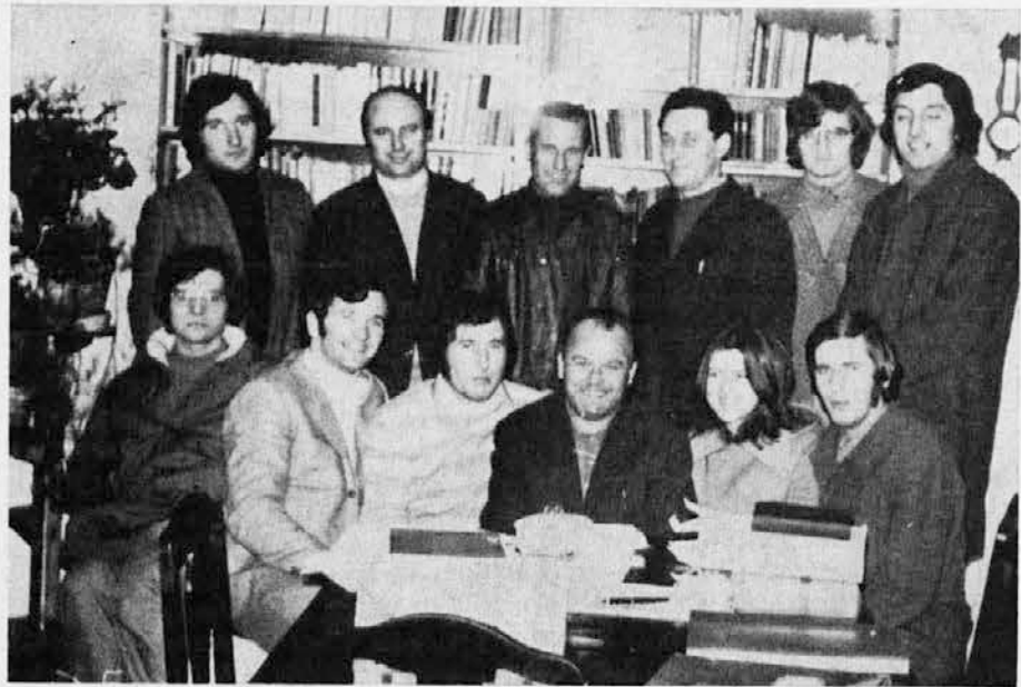
Novo izvoljeni odbor društva »Hrast« iz Doberdola

V ponedeljek 22. januarja zvečer so se člani in prijatelji našega društva zbrali v župnijski dvorani na občni zbor, da slišijo poročilo odbora o dveletnem delovanju društva in da izvolijo nov odbor.