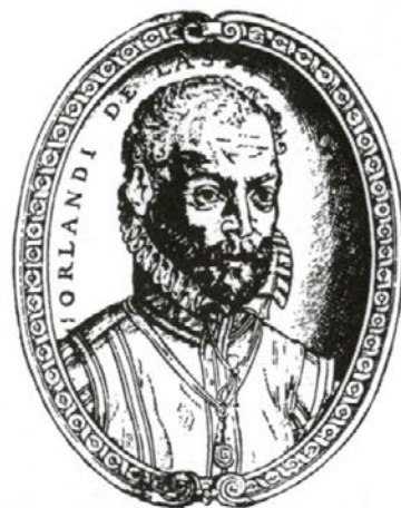
Orlando di Lasso