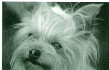
Alergen živali - dlaka

Približno 10% bolnikov z astmo ne prenaša Aspirina in nesteroidnih protivnetnih zdravil kot so Brufen, Ketonal, Voltaren, Naprosyn, Naklofen, Indocid, Erazon in drugi. Zato svetujemo bolnikom z astmo le paracetamol - Panadon, Lekadol. Pri bolnikih z astmo so prepovedani