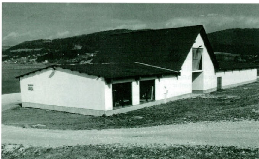
Čolnarna je že nekaj let skladišče pohištva za begunski center.

Zametki Kluba vodnih športov Velenje segajo v leto 1983 v tedanji Jadralni klub, iz katerega so po treh letih izšli s sedanjim imenom. Delovna zagnanost članov v prvih letih se je skrhala ob dolgotrajni borbi za pridobitev primerne klubskega objekta in pomanjkanju donatorjev. Pa vendar so v začetku 90. let pripomogli k formiranju jadralne zveze Slovenije in do danes le uspeli urediti čolnarno ob Velenjskem jezeru. In še končno sestli za mizo skupaj s predstavniki našega podjetja, ki je lastnik čolnarne, in TRC Jezero ter zastaviti program delovanja kluba v skladu z načrti in s ponudbo celotnega centra.