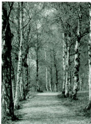
Alergen - pelod breze