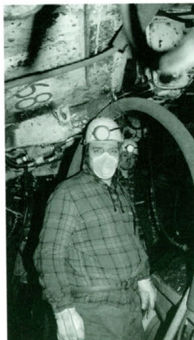
Za varno delo so potrebna zaščitna sredstva.