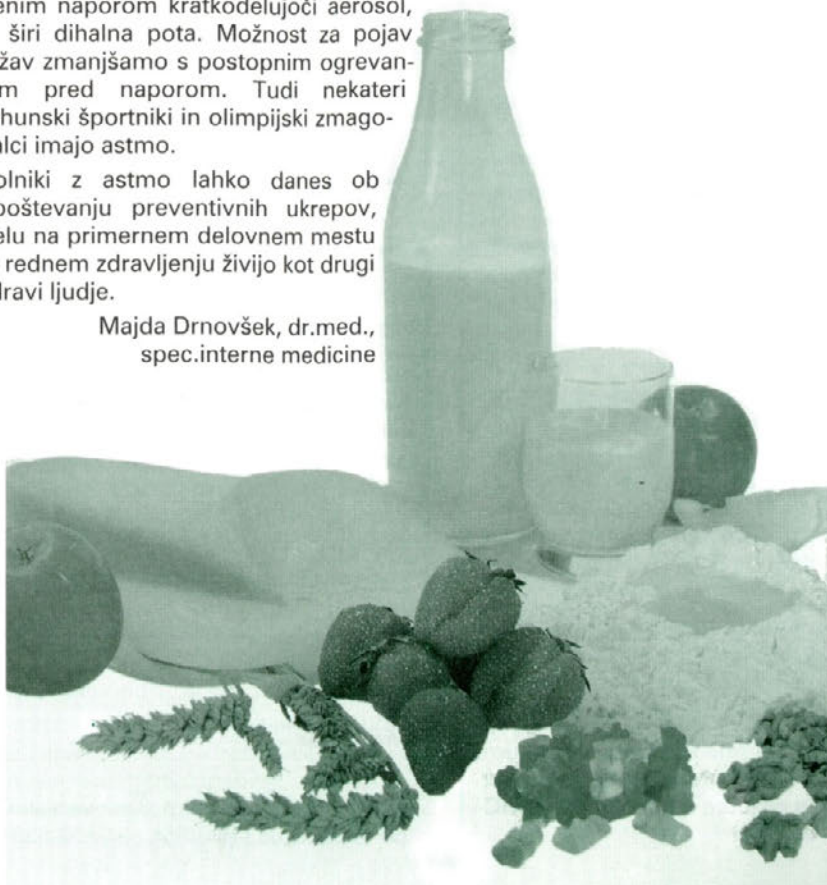
Alergeni v hrani