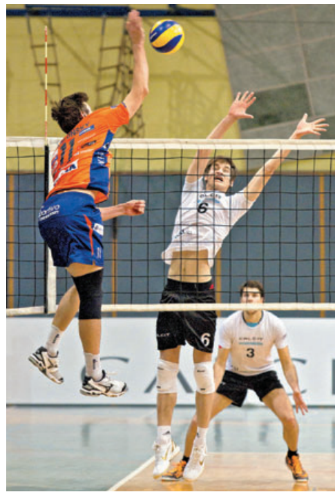
ju je druga ekipa kadetinj minulo nedeljo na turnirju v Stranjah

Z novima dvema zmagama na turnirju v Škofji Loki (proti Lubniku in Krki) so kamniški kadeti potrdili uvrstitev v A ligo. V osmih tekmah so izgubili vsega niz, kar samo dokazuje njihovo nadarjenost. Po dveh porazih na uvodnem kvalifikacijskem turnir-