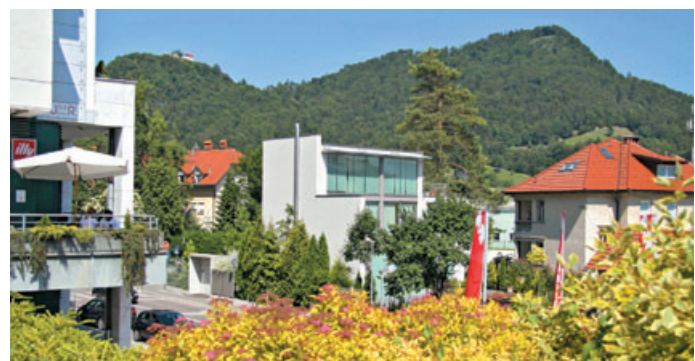
Bela vila, delo biroja Gašperič, je lep primer premišljene arhitekture v Kamniku. Hiša se odpira proti jugu, zapira pa proti severu ter hrupni cesti. Hkrati s svojo poudarjeno višino definira ulični vogal, ter se, kljub temu da gre za enodružinsko hišo, lepo navezuje na sosednje stavbe - Svetilnik.