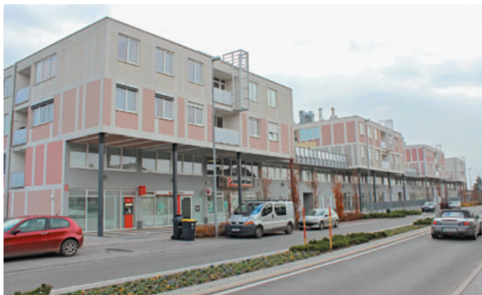
Razstava Stanovanjske ne-politike je opozorila na dobre in slabe primere gradnje v zadnjem desetletju, tudi v kamniški občini. V zadnjih desetih letih je naše mesto spremenilo izgled. Bloki stanovanjskega sklada na Ljubljanski cesti so lahko primer slabe arhitekture, saj je poleg nekvadratne gradnje tudi premalo zunanje infrastrukture, primanjkuje otroških igrišč, zelenic ...

Štajnovci so prepričani, da bo Kamnik šele takrat zares živo mesto, ko bo imelo močno mestno središče, od koder bodo turisti lahko odhajali na ogled