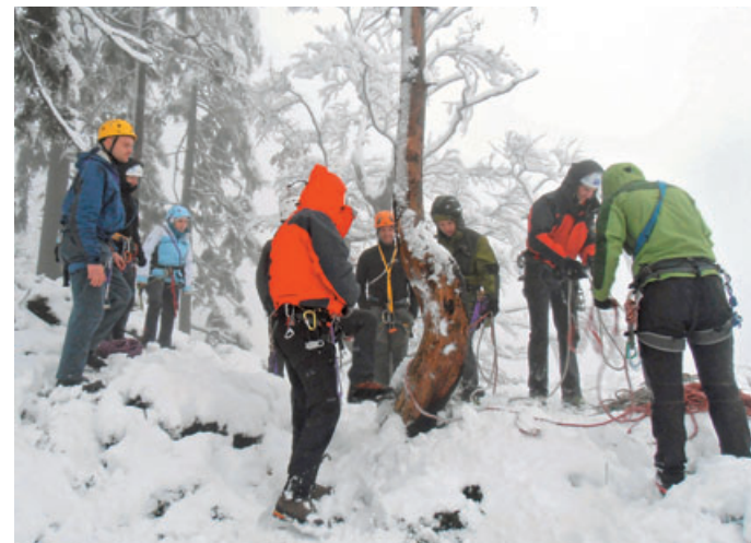
Na vrhu Sivnice med pripravo za spust po vrvi.

Letošnja alpinistična šola AO Kamnik je že v polnem razmahu. Sprejetih je bilo deset fantov in dve dekleti. Začela se je konec septembra s preskusno turo na Korošico, nadaljevala s predavanji in praktičnimi vajami v plezalnem vrtcu na Perovem in na Sivnici, kjer pa jih je malo presenetil novozapadli sneg. Vendar so kljub temu izvedli večino programa. V novembru sledi del iz športnega plezanja, nato pa pred novim kopnim delom še zimski del vključno s plezanjem po zaledenelih slapovih.