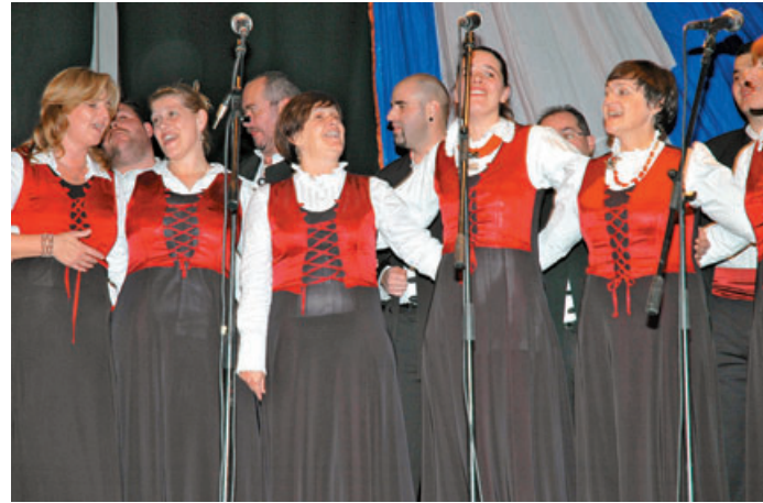
Temperamentne pevke enega redkih in priznanih ženskih klapskih sestavov Gusarica z dalmatinskega otoka Komiža so bile že šestič brodošle gostje srečanja klap v Kamniku.

Navdušeni poslušalci obeh koncertov so z bučnim aplavzom nagradili nastop vsake klape, še posebej pa seveda domače pevce klape Mali grad. Fantje, ki prihajajo iz Kamnika, Komende, Ljubljane, Radovljice in Metlike,