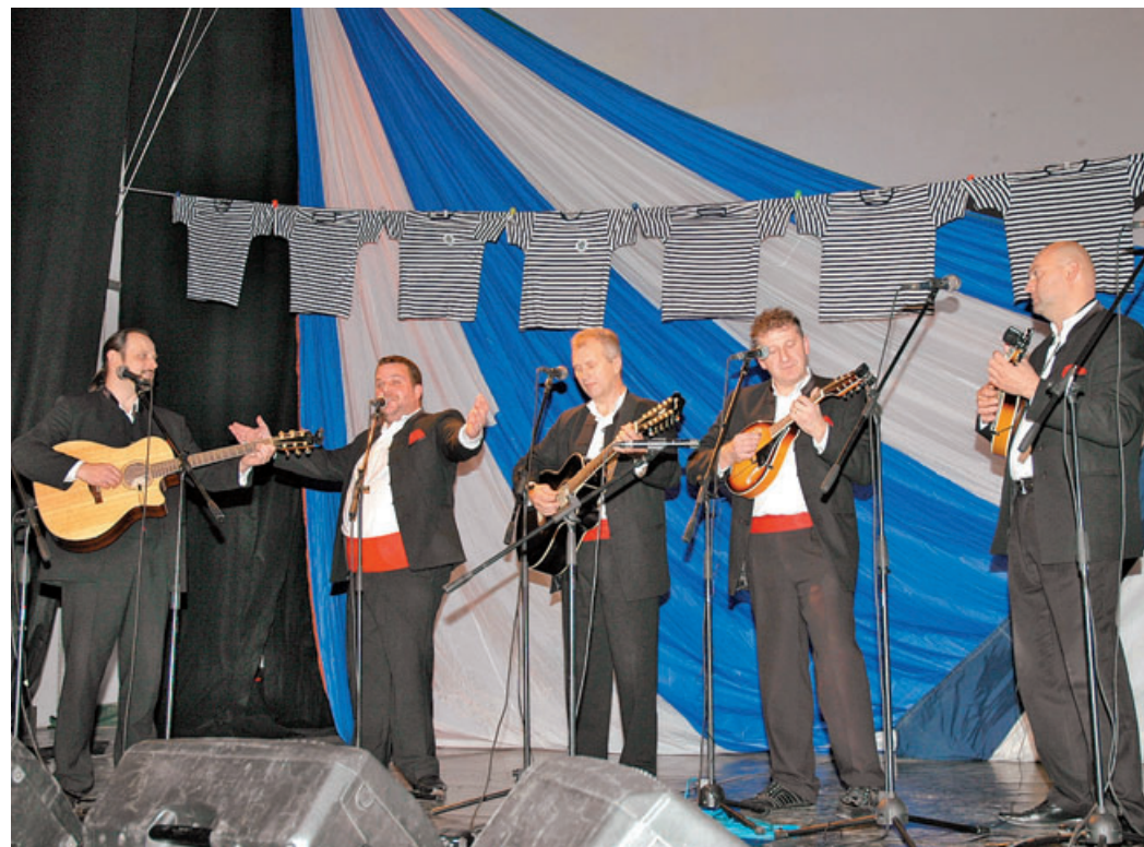
Klapa Kamik iz Kostrene je navdušila s prelepo instrumentalno spremljavo in petjem, še posebej solista.