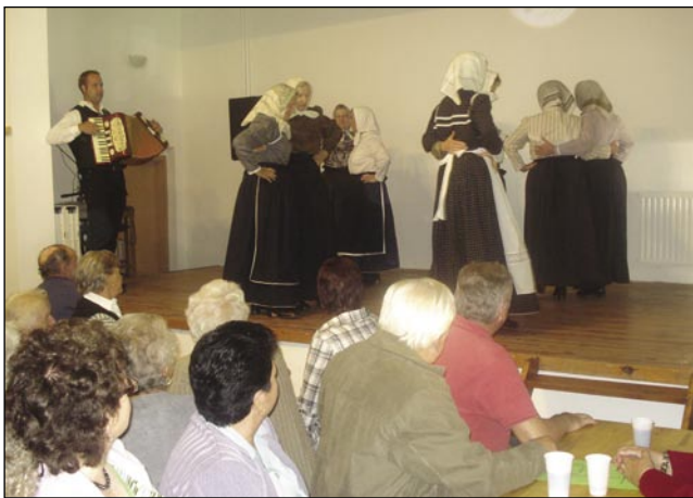
Upokojenska folklorna skupina se je notapokazala v nauvi gvantaj

Ka je pa najlepše bilau, tau je bila upokojenska folklorna skupina. Slovenske penzionistke so nam zaplesale pa spejvale. Vidle so se nam, trno smo jim ploskali. Napisati pa moram tau tó, ka ženske majo lejpoga fudaša, na njegvo muziko ešče z vekšim veseldjom plešejo. Tak mislim, ka če se nekak, steri je že v penziji poda za tau, ka se nika navči pa drugim tó pokaže, je leppo, hvale