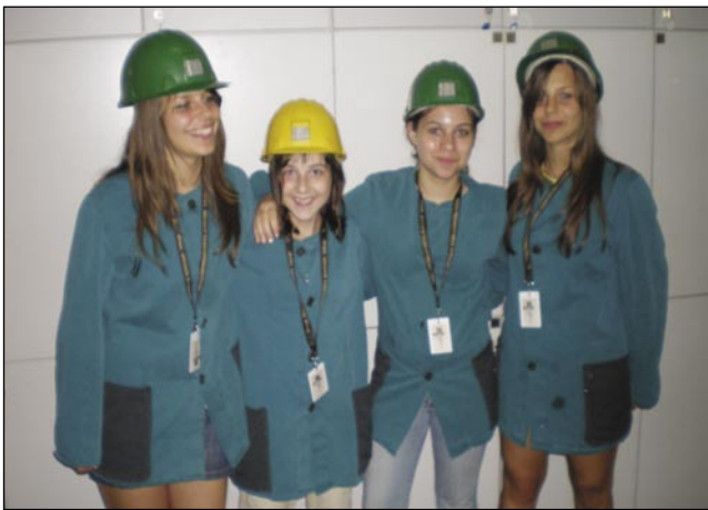
Naše porabske punce v rudniku

Ko sem dobila možnost, da lahko grem kot spremljevalka v likovno kolonijo, sem imela mešane občutke: na eni strani sem bila zelo vesela, ker sem se pred osmimi leti tudi sama udeležila ustvarjalnega tedna v Vuzenici, kot učenka števanovske šole, zato sem pričakovala, da bom videla znane in že dolgo nevidene obraze. Na drugi strani pa sem bila odgovorna za naše porabske punce.