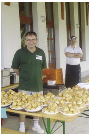
Kūjar iz Lipe, stera je pripravila gesti za piknik