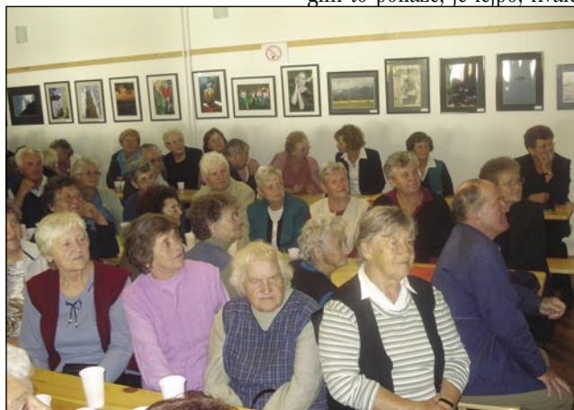
Penzionisti iz Slovenske vesi, Gorenjoga Senika pa gostje iz Murske Sobote