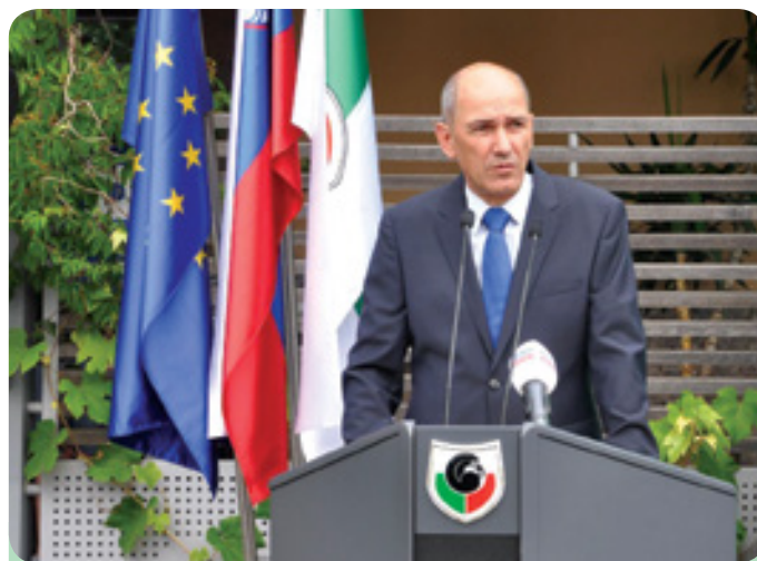
Zbrane je nagovoril poslanec Državnega zbora RS Janez Janša.