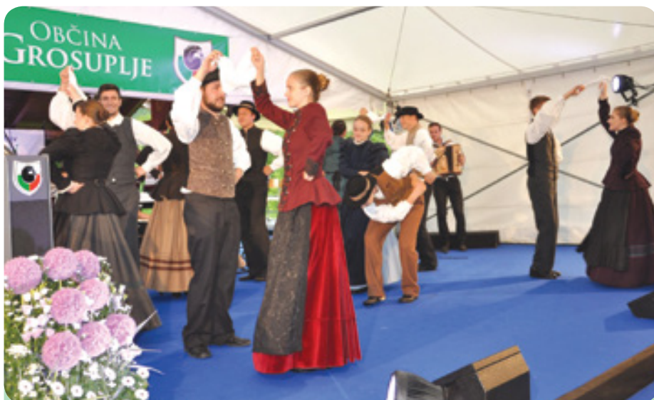
Folklorna skupina Račna