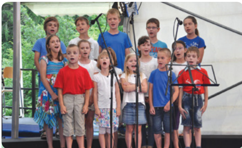
Otroški pevski zbor OŠ Šmarje – Sap