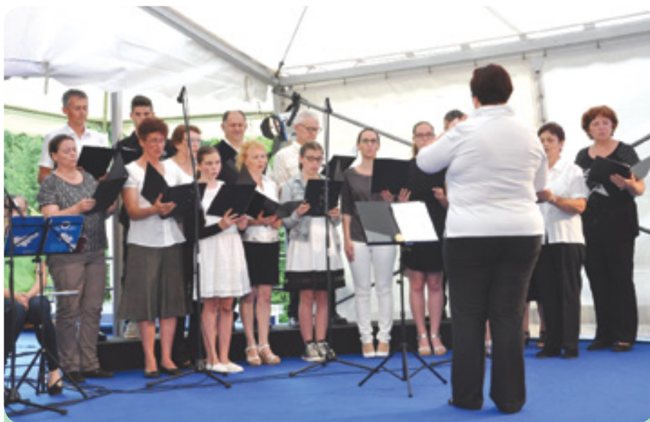
Škocjanski mešani zbor