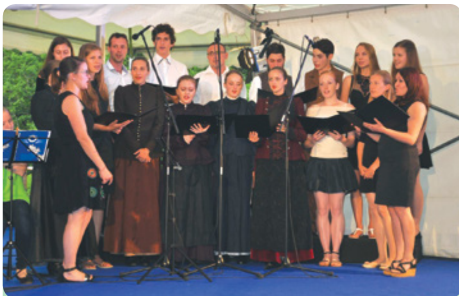
Mladinski pevski zbor Kopanj