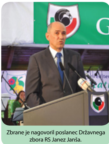
Zbrane je nagovoril poslanec Državnega zbora RS Janez Janša.

čju in vsem svetnicam in svetnikom Občinskega sveta Občine Grosuplje, ki so soglasno sprejeli odločitev, da se vpadnico v mesto Grosuplje poimenuje po dr. Jožetu Pučniku, očetu slovenske državnosti. Hvala vsem, ki nosijo Slovenijo v srcu.