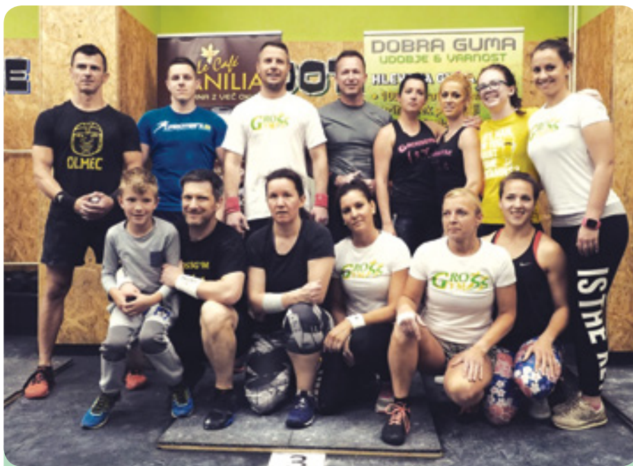
Tekmovalna ekipa Grossgym Grosuplje