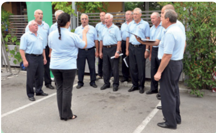
Z domoljubnimi pesmimi je prireditev obarval Moški pevski zbor Šmarje – Sap.