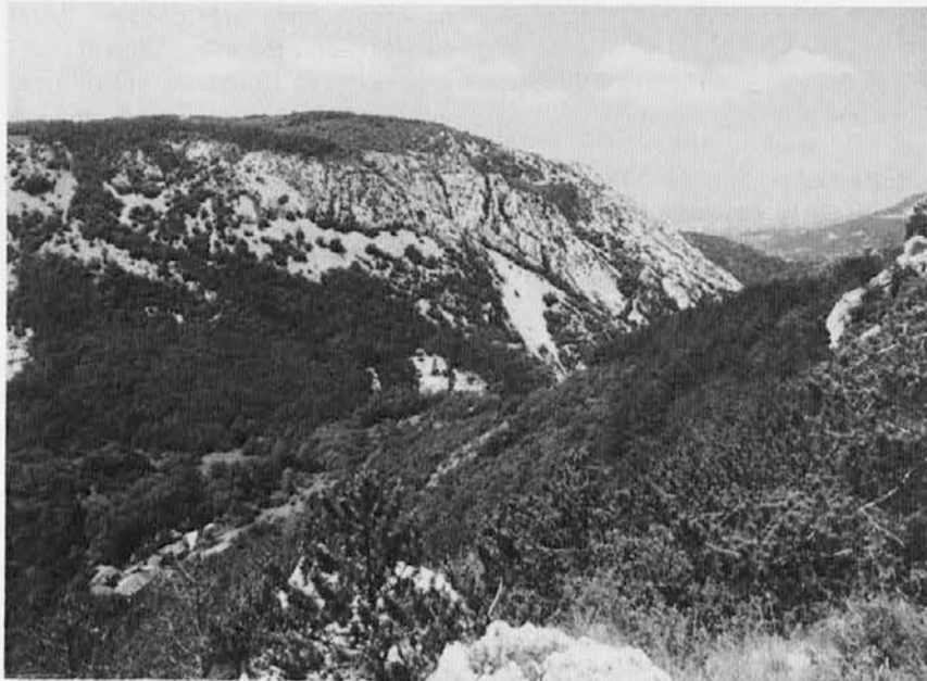
GLINŠČICA: čudoviti kraj Botač pod Drago, kamor zahajajo mnogi turisti, poleti pa se v Glinščici lahko tudi kopajo.

buda mednarodnega leta družine mimo nas.