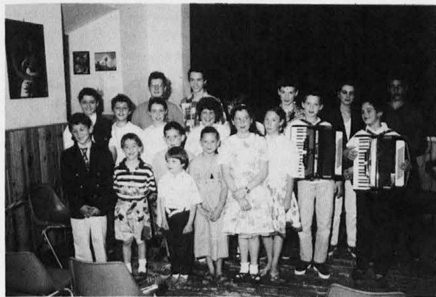
Nastopajoči v Podgori 3. junija letos

Pred zaključkom šolskega leta 1993/94, ki ga bo sklenil Glasbeni poklon gojencev v treh večerih (sobota, 11. junija, Kulturni dom; sredo, 15. junija, goriški grad; petek, 24. junija, cerkev Sv. Ivana v Gorici), so se gojenci predstavili staršem, prijateljem in drugim, ki zvesto sledijo njihovu trudu, v nizu notranjih nastopov po slovenskih vaseh.