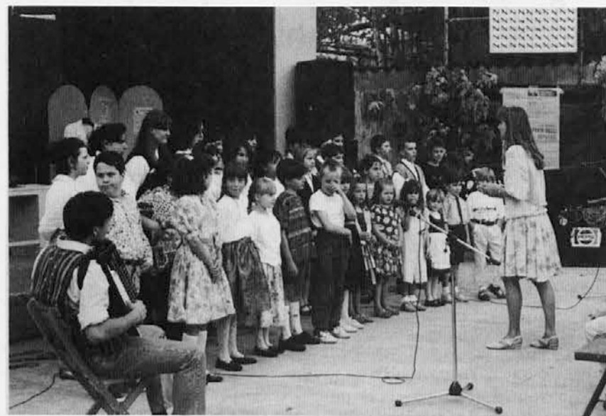
Skupni zbor štandreških otrok

V Štandrežu je sicer vsako leto manj špargljev, so pa prireditve v okviru Praznika špargljev vedno bolj zanimive, privlačne in pestre. Letos so organizatorji Prosvetnega društva Štandrež poskrbeli, da so bile na programu nove pobude, ki so privabile v Štandrež lepo število ljubiteljev slovenske pesmi in besede, pa tudi takih, ki se radi zavrtijo ob zvokih prijetne glasbe in pojedjo kaj okusnega ali spet takih, ki radi poskusijo srečo v tomboli ali srečolovu.