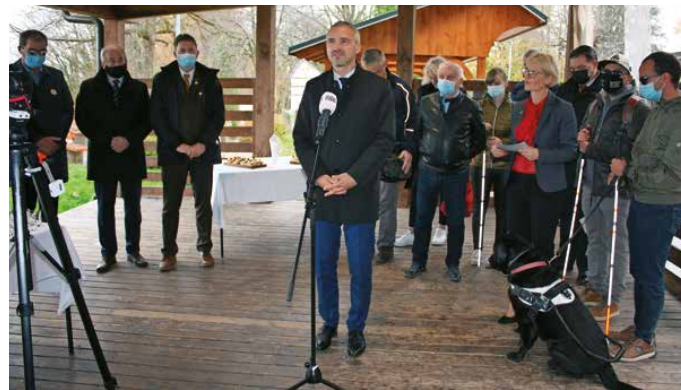
Učno pot smo javnosti predstavili skupaj z ministrom za delo, družino, socialne zadeve in enake možnosti Janezom Ciglerjem Kraljem.

Ambroževa maša ČD Stična: 5. decembra 2021 ob 10. uri v baziliki Žalostne Matere Božje v Stični. Omogočen bo prenos v živo na Facebooku.