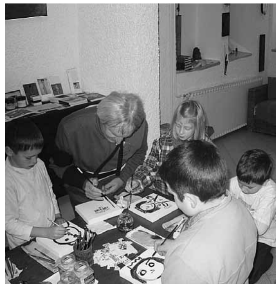
Pri slikarju