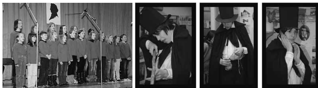
Ne vrag, le sosed bo mejak, Dr. Fig