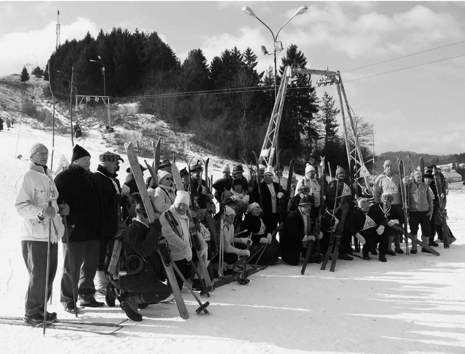
»Starodobniki« so v različnih starostnih kategorijah vijugali po stometrski progi.

TEKMOVANJE STARODOBNIH SMUČARJEV IN SMUČARK - INTERVJU Z MATJAŽEM KURENTOM.