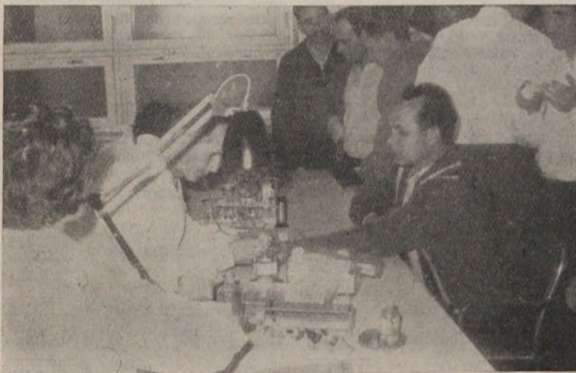
Člani delovnih kolektivov so se v polnem številu odzvali vabilu

Prvi krvodajalci v tem letu so bili člani postaje LM, iz podjetja Indos je prišlo na Zavod za transfuzijo krvi 43 članov kolektiva, iz Zime 18, Javnih skladišč 30, Ko-