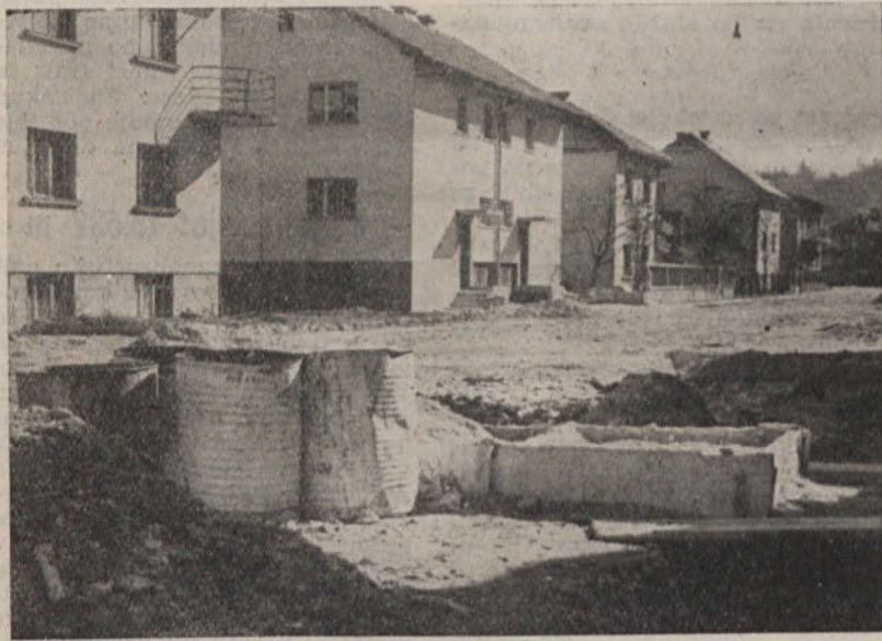
Najprej sezidamo stavbe, uredimo kanalizacijo in ostale priključke in šele nato dokončno uredimo ulice. Ta vrstni red prikazuje tudi naš posnetek

z ostalimi komunalnimi dejavnostmi lahko ugotovimo, da javna razsvetljava najbolj zaostaja. Nova stanovanjska naselja so brez javne razsvetljave, kar daje neestetski videz, ogrožen je promet, zlasti pa premoženje in varnost prebivalstva. Ze izvršena dela na