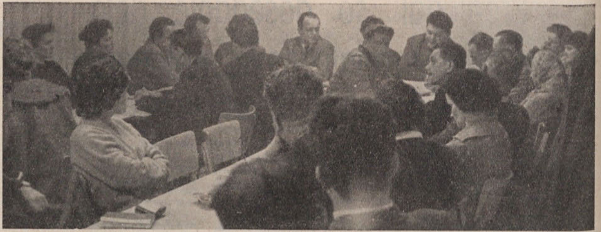
POSVETOVANJE O MLADINI