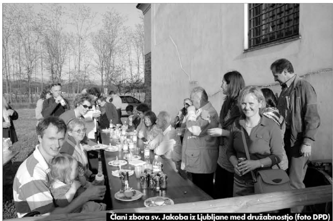
Člani zbora sv. Jakoba iz Ljubljane med družabnostjo