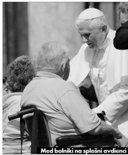
Med bolniki na splošni avdienci