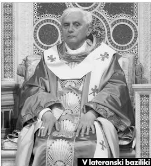
V lateranski baziliki

že pred leti poudaril, da so blaženi vzor zlasti krajevni, sveti pa vesoljni Cerkvi. Velik dogodek je bila nedeljska maša na Trgu sv. Petra, ko so verniki še enkrat napolnili trg v objemu Berninijevega stebrišča. Sveti oče je tokrat spregovoril o sredstvih družbenega obveščanja in povedal, da so nekak dvorezen meč. Po eni strani lahko omogočajo medsebojno spoznavanje in dialog med ljudmi, po drugi strani pa lahko netijo predsodke in mržnjo med posamezniki oz. narodi. Na ta 39. svetovni dan sredstev družbenega obveščanja je odločno poudaril moč, ki jo ima v današnjem svetu komunikacija. Spomnil se je na njeno vlogo ne nazadnje ob smrti Janeza Pavla II., ko je dokazala, kaj vsega lahko stori v spodbujanju solidarnosti in razumevanja med vsemi ljudmi. Opozoril pa je tudi, da v času, ki je bolj naklonjen podobi kot pa besedi, so sredstva obveščanja lahko tudi zlorabljena. Res je, da lahko naredijo veliko dobrega za širjenje miru, pa tudi nasilja. Zato, je pozval odgovorne, "je potrebno, da se vsi potrudijo narediti, kar je v njihovi moči, da bi zagotovili