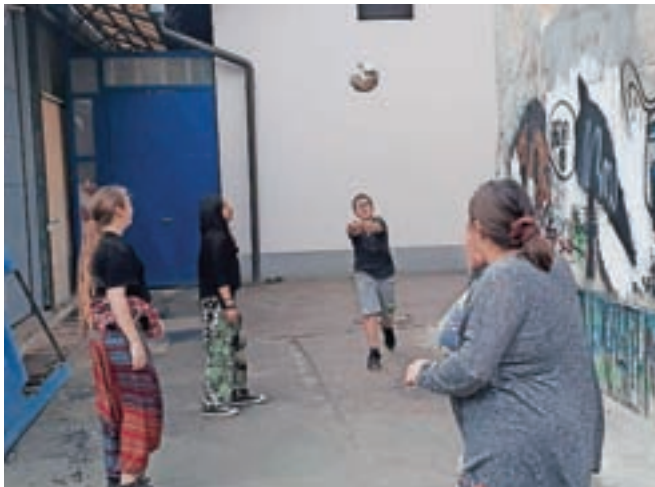
V društvu Makadam spodbujajo aktivno preživljanje prostega časa mladih.

Mladi so dnevno sobo odlično sprejeli, kar potrjuje tudi zapis ene od rednih obiskovalk: »Dnevna soba mi nudi nekakšen dom, poleg tega, ki ga že imam. In ta dom je prav tako kot moj prvi dom nenadomestljiv. Upam, da bo Dnevna soba ostala taka, kot je, še mnogo let.« A kljub najboljši volji prostovoljcev Kamnik utegne izgubiti pomembno varno točko za mlade. Zaradi niz-