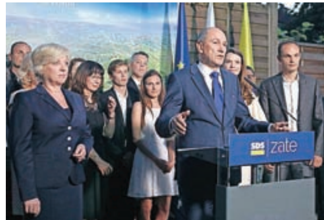
Zmagovalac državnozborskih volitev je Janez Janša s stranko SDS.