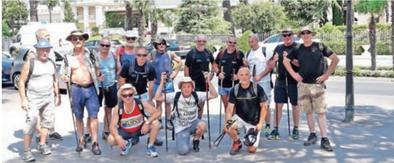
Pohod članov Društva Dogodek Kamnik ob slovenski obali

Društvo Dogodek Kamnik je bilo ustanovljeno leta 2013 z namenom spodbujanja zanimanja za kulturo športa in rekreacije, ohranjanja zgodovinskega spomina ter spoštovanja kulturne dediščine, negovanja domoljubja kot temeljne skupne vrednote.