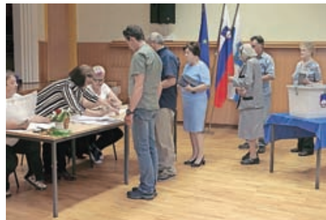
Nedeljske volitve na volišču v Šmarci

»Izid smo pričakali veseli in zadovoljni z vedenjem, da po teh volitvah ne bo lahko, da bo naporno, predvsem bo težko sestaviti vlado. Relativnemu zmagovalcu volitev čestitam, čeprav mi ostajamo pri svojih besedah iz volilne kampanje, da se v koaliciji s SDS ne vidimo. Želimo pa jim srečo pri sestavljanju koalicije,« je po nedeljskih volitvah dejal Marjan Šarec. Sam si želi sredinsko vlado in verjame, da bo dobil priložnost za sestavljanje nove vlade s tistimi, ki imajo podobne cilje kot LMS. »Slovenija je v letu 2018, zato potrebuje pogled naprej, potrebujemo razvojno naravnano vlado, ki se ne bo ozirala na pretekle razlike, ki jih je pri nekaterih še veliko čutiti. Zato je čas za novo generacijo vodenja, ki si prizadeva za prihodnost, za reševanje tistih problemov, o katerih poslušamo že zelo dolgo, rešili pa se niso. V LMS je zbrana ekipa ljudi, ki ve, kaj Slovenija potrebuje in kam bi rada prišla. Tako bomo v prihodnje tudi delovali.« V koalicijo z relativnim zmagovalcem volitev pa pravi, da ne bodo šli, pač pa čakajo na priložnost, da sestavijo novo vlado, ki bo usmerjena naprej, bo operativna in se ne bo zaustavljala ob problemih, pač pa jih bo reševala.