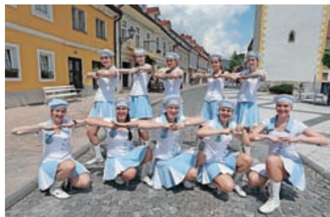
Godbeniki tesno sodelujejo tudi s članicami Društva kamniških mažoretok Veronika, ki so se jim pridružile tudi na tokratnem praznovanju.