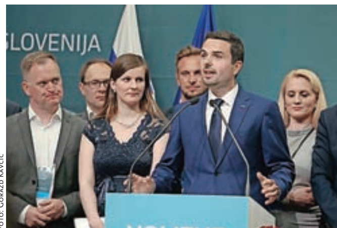
Matej Tonin z ženo in somišljeniki v medijskem središču

Ko se je zahvaljeval volivcem, je predsednik NSi Matej Tonin omenil »epsko bitko«, ki je potekala v kamniški volilni enoti, in ob tem izrazil hvaležnost volivcem v domači Tuhinjski dolini, ki so se pri volilni udeležbi dobro odrezali in mu pomagali do izvolitve. Čestital je tudi SDS, zmagovalki volitev, in dodal, da rezultat ne omogoča lahke sestave vlade in lahkega vladanja. In kakšna naj bo po njegovem koalicija, ki bo vladala v tem mandatu? »Kakršna koli enoblokovska koalicija bi pomenila ogromno težav, zaradi tega je v tej situaciji po moje za Slovenijo najboljša sestavi koalicijo preko političnih bregov. Zgolj taka lahko na dolgi rok zagotovi Sloveniji neko stabil-