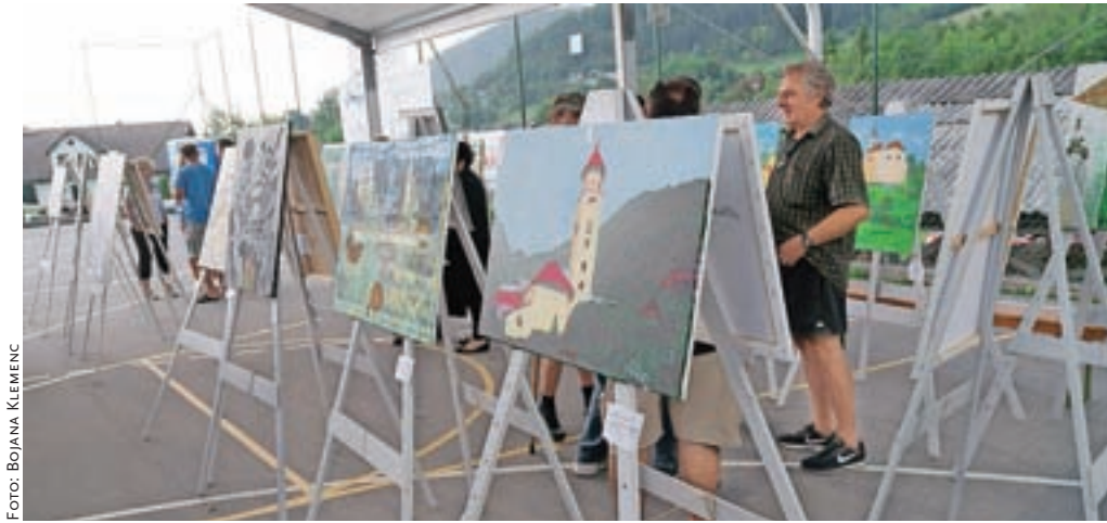
Prvega mednarodnega slikarskega ekstempora na Selih se je udeležilo 24 slikarjev in slikark.