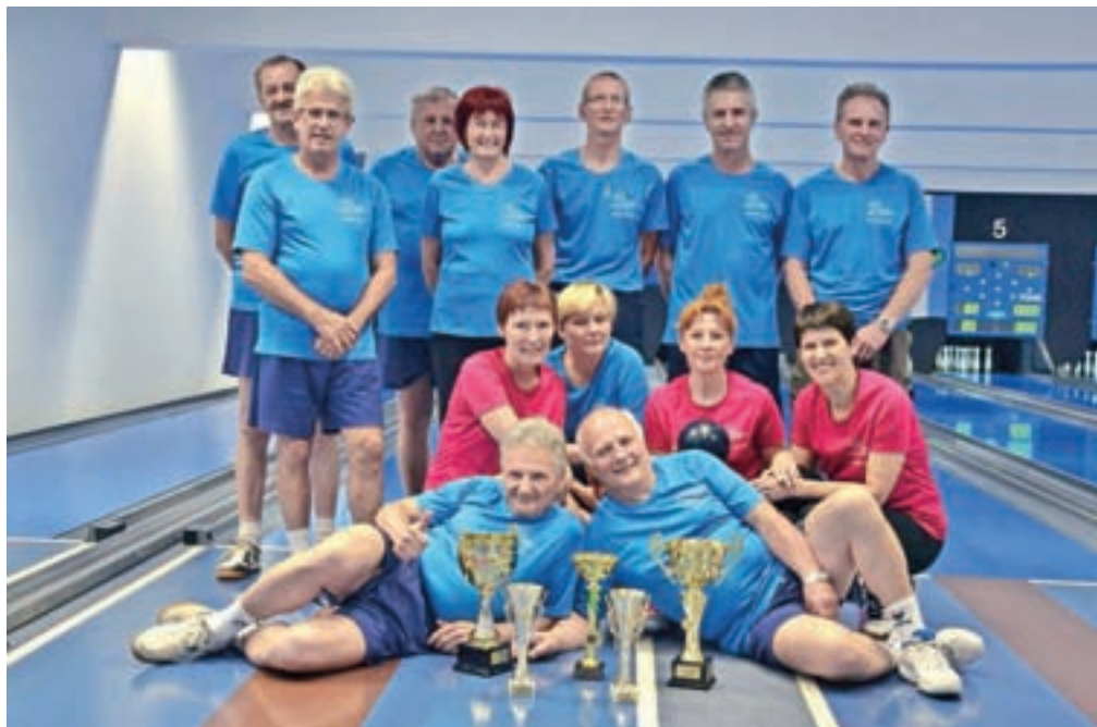
Ekipa kegljaške sekcije Društva upokojencev Kamnik

Ker pa jim veliko pomeni dobra volja in veselo razpoloženje, se bodo še pred tem odpravili na izlet, menda v bohinjske konce.