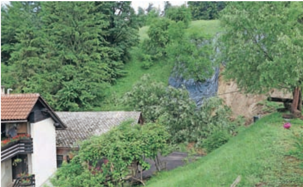
Zemeljski plaz v Košihah je prestrašil stanovalce bližnje hiše, ki so noč preživeli pri sorodnikih, a stavbe k sreči ne ogroža več.

Občina Kamnik je občane že pozvala, naj nastalo škodo prijavijo štabu CZ Kamnik.