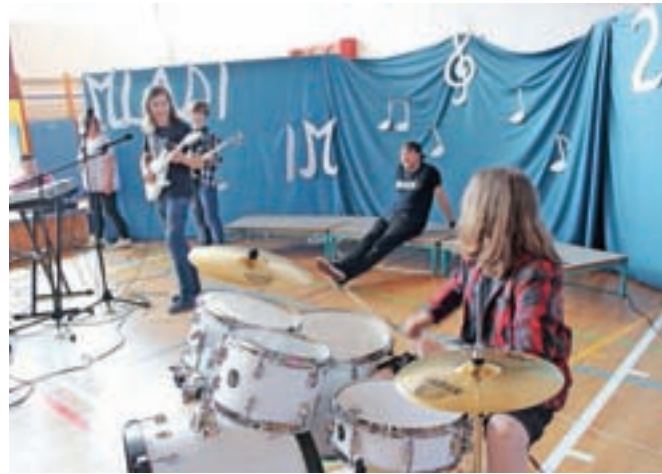
Mladi so darilo – komplet bobnov in električno kitaro – takoj z navdušenjem preizkusili.