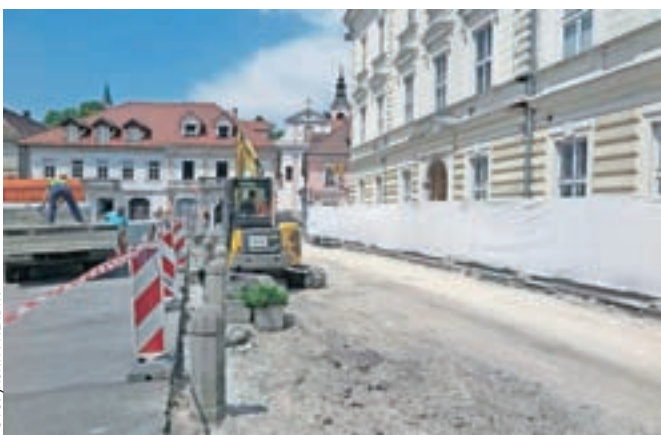
Maistrova ulica je zaradi prenove za promet že zaprta.

Gradbena dela prinašajo tudi spremembo prometnega režima, in sicer je obvoz za voznike s severnega dela urejen preko Šutne in Cankarjeve ceste, velja pa posebej opozoriti, da bo v času gradnje promet na Glavnem trgu med pošto in sodiščem dvosmeren, zato je parkirišče za kratkotrajno parkiranje pri pošti zaprto. Enosmerni promet po Tomšičevi ulici (mimo policije) poteka nemoteno.