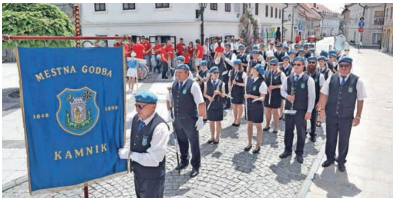
Godba je pomemben del Kamnika že sto sedemdeset let.

Kamniški godbeniki so prejšnjo soboto počastili 170-letnico godbeništva v Kamniku in 120. obletnico ustanovitve Mestnega godbenega društva, s čimer kamniška godba sodi med štiri najstarejše na Slovenskem.