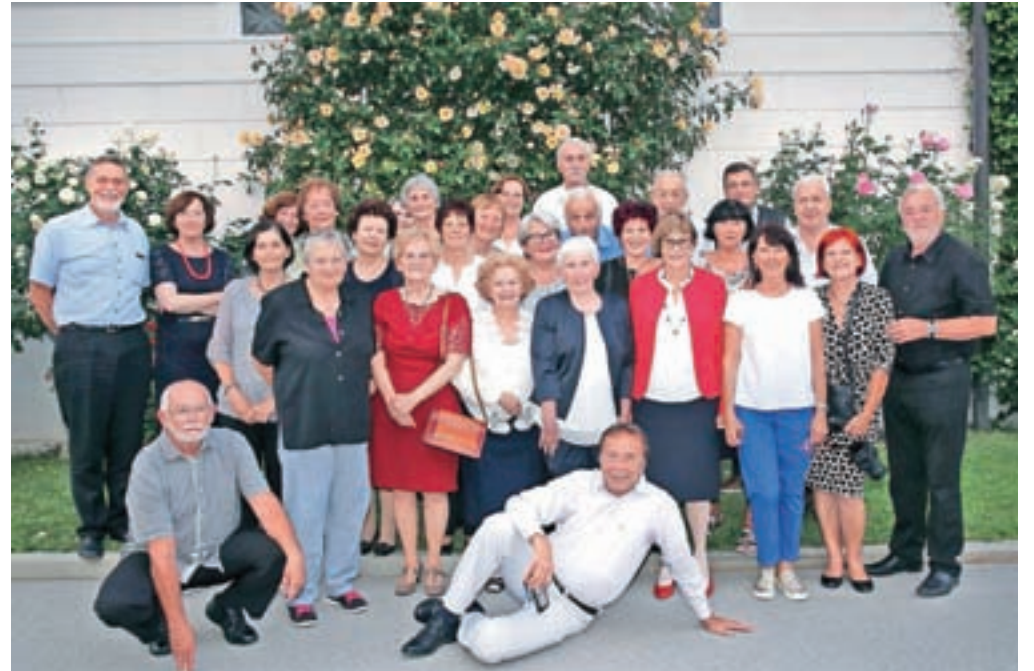
Nekdanji sošolci kamniške gimnazije, ki so maturo opravili pred petdesetimi leti.

Petdeseto obletnico mature na kamniški gimnaziji je minuli petek praznovala generacija 1964–68. V dveh razredih jih je bilo 46, na veselem druženju v Prašnikarjevem dvorcu pa se jih je zbralo kakšnih trideset.