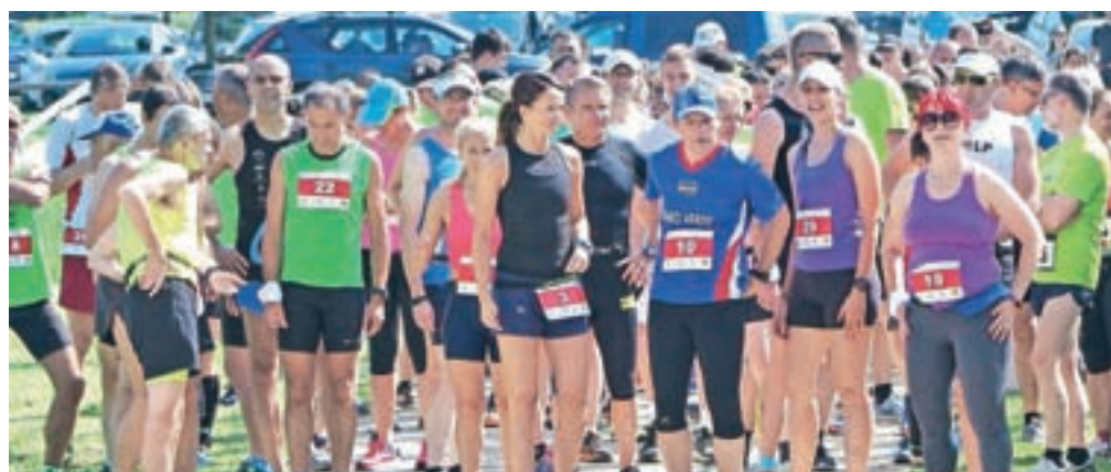
Dobrodelnega teka se je udeležilo več kot 150 tekačev in tekačic.