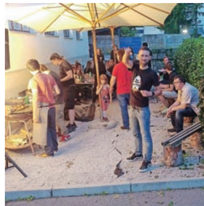
Pozdrav iz Kotla so tudi letos zaznamovali kultura, glasba, šport in seveda zabava.

usvojeno znanje našega jezika. Dogajanje je zaokrožil super glasbeni večer s koncertom kamniške alternativne skupine Fat pigeon in nemško-koroških rokerjev 7am-on tour. »Včasih je bil Pozdrav iz Kotla večdnevni festival, sedaj pa imamo že čez leto toliko odmevnih dogajanj, da je