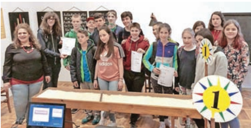
V muzeju cirilice smo se trudili brati in pisati.

V četrtek smo dopoldansko malico pojedli na peščeni plaži letovišča v Albenu s pogledom na Črno morje, kjer smo tudi preverili njegovo temperaturo. Pot smo nadaljevali proti Aladži, kjer je v skalo vklesano nekdanje prebivališče menihov. Po kosilu ob morju pa smo pogledali še v nočno nebo v planetariju. Zadnji dan skupnega druženja smo si ogledali muzej cirilice, kjer smo se trudili brati in pisati. Preden smo se poslovili ter razšli vsak svojo pot, polni novih poznanstev in izkušenj, pa smo si ogledali še ostanke prve bolgarske prestolnice.