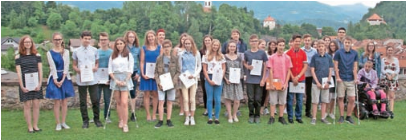
Letošnji nagrajenci kamniških osnovnih in srednjih šol

Župan Marjan Šarec je pred koncem šolskega leta najboljšim učencem in učenkam kamniških šol podelil priznanja.