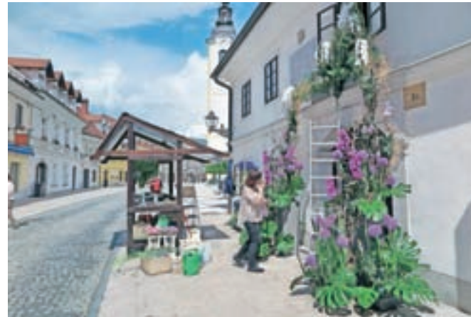
Cvetličarji so takole okrasili portal vrat Rojstne hiše Rudolfa Maistra na Šutni.

»S prireditvijo v celoti smo zadovoljni, saj je Kamnik obiskalo veliko turistov, ki so si ogledovali cvetlične