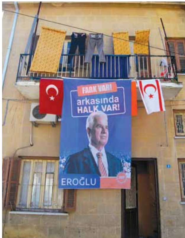
Slika 6: Plakati Dervisa Erogluja v času predsedniške volilne kampanje aprila 2010 visijo na fasadah hiš v severni Nikoziji.

V aprilu 2010 izvoljen predsednik TRSC Dervis Eroglu, ki prihaja iz vrst nacionalistov, je povzročil vrsto neodobravanja med tujimi opazovalci, zaradi bojazni, da bo ogroženo nadaljevanje pogajanj, ki sta jih začela njegov predhodnik Mehmet Ali Talat in predsednik grških Ciprčanov Dimitris Christofias.