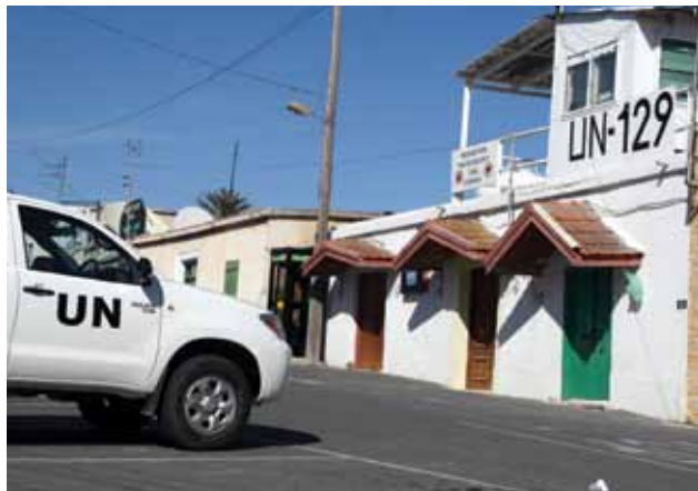
Slika 3: Kontrolni stolp in vozila vojakov OZN na glavnem trgu Pyla, kjer prebivajo tako pripadniki grških kot turških Ciprčanov (foto: Tobias Schwämmle).

priprave na delitev otoka. Leta 1971 je general Grivas s svojimi somišljeniki pri svojem delovanju uporabljal teroristične akcije in uspel ponovno organizirati gverilsko organizacijo, imenovano Nacionalna organizacija bojnikov za Ciper (EOKA-B). Program organizacije je predvideval popolni izgon turških Ciprčanov z otoka. Po smrti Grivasa je Makarios III.