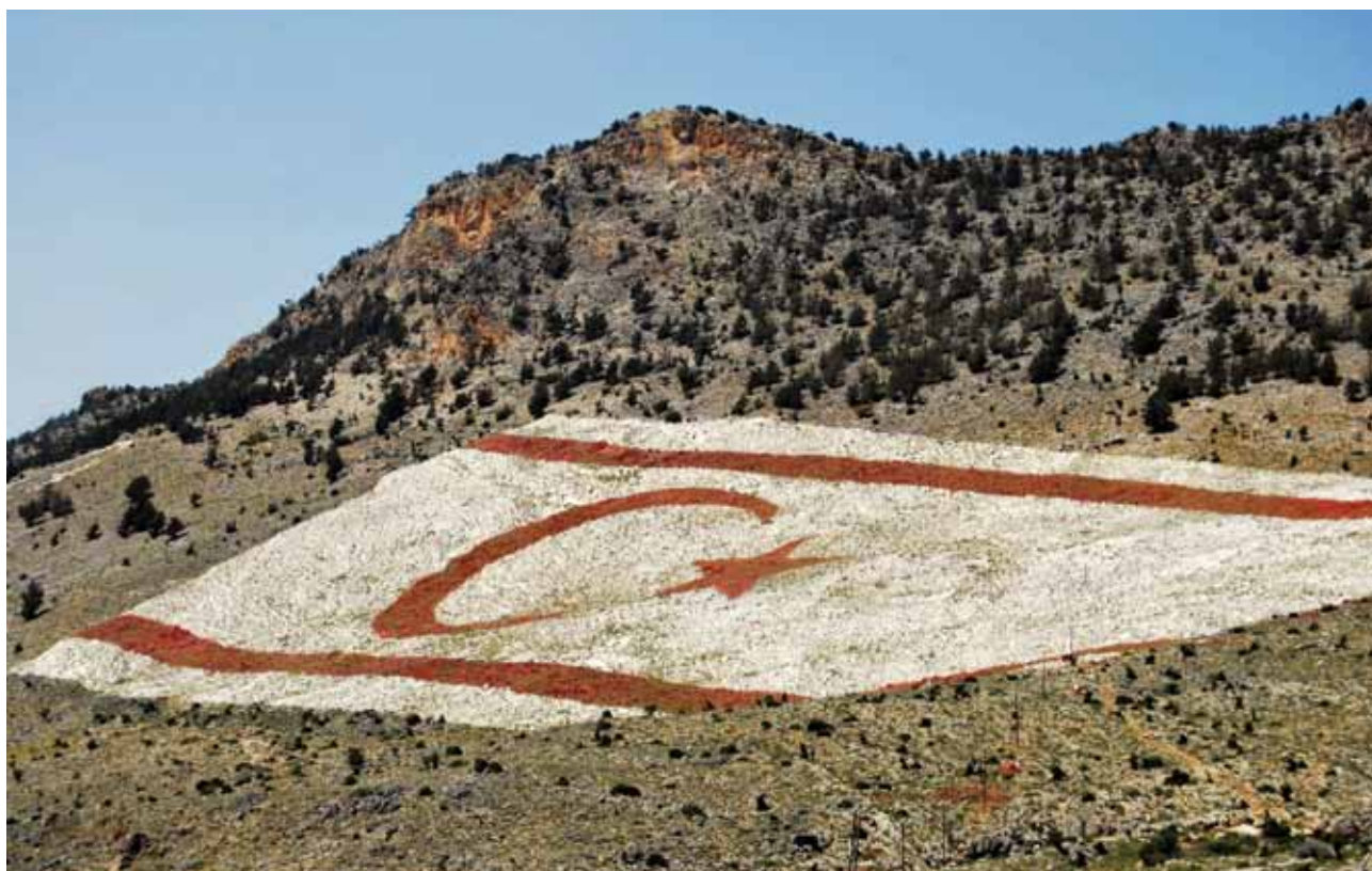
Slika 5: Zastavo nepriznane države Turške republike severni Ciper so izrisali na vzpetini nad severnim delom Nikozije.

Grška stran razpolaga z vodo, ki priteka iz naravnih izvirov izpod gorovja Troodos (v kolikor izviri poleti ne presahnejo zaradi suše), ki jo poskušajo zadržati s pomočjo številnih umetnih jezov. Umetni jezovi so prav tako trend na turški strani, toda poleg manjšega porečja so podvrženi še eni težavi - zaradi vseprisotne korupcije je gradbenim podjetjem zmanjkalo sredstev za njihovo gradnjo ali pa jezov preprosto niso dokončali. Poleg tega se stoječa voda na Cipru zaradi visoke stopnje evaporacije intenzivno zasoljuje (7).