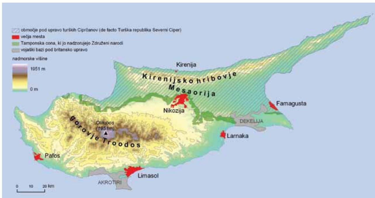
Slika 1: Karta Cipra, na kateri se vidi potek Tamponske cone, glavne reliefne enote in poselitvene poteze (avtor: Peter Kumer, vir prostorskih podatkov: Boštjan Rogelj).

V obdobju med drugo svetovno vojno so se začele ustanovljati različne politične stranke. Na občinskih volitvah so slavili svojo zmago komunisti oziroma Progresivna stranka delovnega ljudstva (AKEL). Ideje Enosis so bile že močno utrjene v glavah vseh grških domačinov. Uresničitev ciljev tega političnega programa so podpirali vsi - tako politične stranke, ljudstvo kot tudi cerkev (4). Podporo so dobili tudi s strani Grčije, ki je očitno obžalovala svojo odločitev iz leta 1915, ko je Anglija ponudila Ciper Grčiji pod pogojem, da bi se Grčija bojevala na strani Angležev, a je Grčija ponudbo zavrnila. Zato je podala predlog, da bi končno prevzela oblast nad otokom, vendar je Velika Britanija želela obdržati Ciper kot strateško bazo in je idejo gladko zavrnila. Na grški strani je odigral odločilno vlogo ciprski nadškof