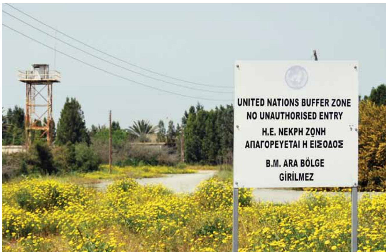
Slika 4: Na območju Tamponske cone, ki je pod nadzorom modrih čelad je gibanje strogo omejeno.

Na otok so načrtno naselili prebivalce Turčije (leta 1999 se je število turških priseljencev povzpelo na 115.000), njihov odnos do nezakonito pridobljene lastnine pa je bil zaničevalen (vrnitev premoženja ostaja še danes nerešeno vprašanje). Uničevali so pravoslavne cerkve nekaj so jih spremenili v mošeje ali pa pustili propadati. Spremenili so imena mest in vasi. Z domov je bilo izgnanih po različnih ocenah med 142.000 in 160.000 grških Ciprčanov, kar je predstavljalo četrtnino vsega prebivalstva.