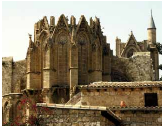
Slika 2: Mošeja Lala Mustafa paša, ki je bila spremenjena v muslimanski verski objekt v 16. stoletju, ko si je Otomanski imperij priljučil Famagusto na severnem Cipru. Pred tem je bila krščanska katedrala Svetega Nikolaja zgrajena v gotskem slogu.

Intenzivni program Erasmus (na kratko: Erasmus IP) je oblika pedagoškega dela, ki posredno vključuje tudi študentsko raziskovalno delo – predvsem z namenom podajanja vsebin, ki jih ni v obstoječih študijskih programih. Program (ki traja v našem primeru 12 dni) se izvaja na izbranem teritoriju in zajema intenzivno raziskovanje in izobraževanje na terenu. Aprila leta 2010 je Erasmus IP z naslovom Evropske socio-kulturne meje – podedovano dojemanje in moderne pokrajine potekal na Cipru v okviru štirih tematskih delovnih skupin (okoljevarstvo, ekonomsko - geografski odnosi, socio- in kulturno - geografski odnosi ter razvoj podeželja in pokrajine), ki so se ga udeležili študenti in profesorji geografije iz Portugalske, Španije, Avstrije, Velike Britanije, Romunije, Litve, Cipra in Slovenije.