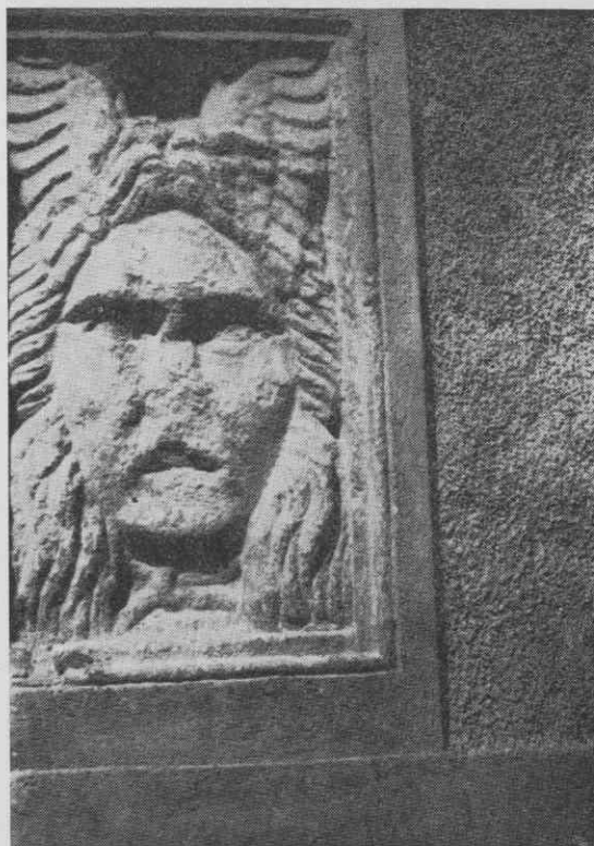
Relief Meduzine glave vzdian na pročelju hiše na Orožnovem trgu 2 v Laškem

2. Na severni strani kaplanije (Aškerčev trg 2) je vzdian drugi antični relief. Na njem je upodobljena po rimski šegi oblečena moška oseba — mož je oblečen v tuniko in sagum — ki vodi na vrvi privezano žival, kosmatega psa, v ozadju pa se je na krivenčastem stebelu