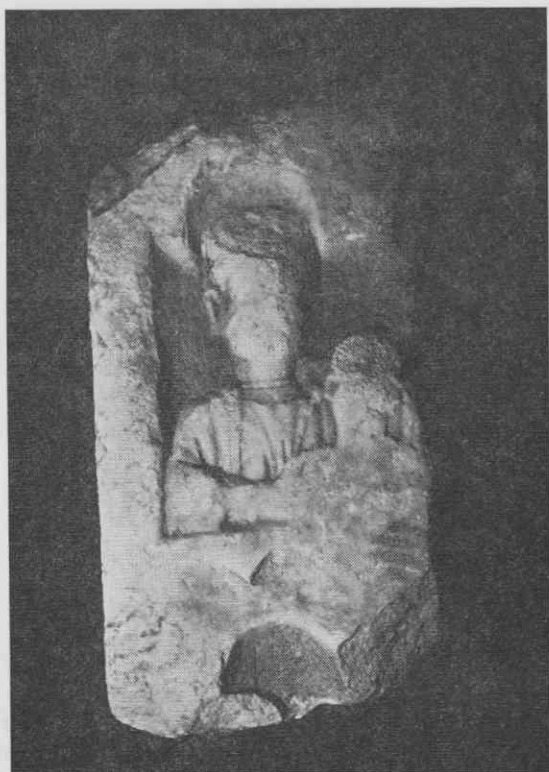
Fragmentarno ohranjen rimski družinski nagrobnik s podobo matere in otroka. V muzejski zbirki v Laškem

no že na začetku železne dobe, v 8. stoletju pred n. št. Kje je bila prazgodovinska naselbina, kolikšen je bil njen obseg in kako dolgo je trajala še ne vemo. O navzočnosti Keltov v 1. stoletju pred n. št. v Laškem govorijo najdeni keltski novci. Svoj razcvet pa je kraj doživel s prihodom Rimljanov, ki so s pridom izkoriščali termalne vrelece v Laškem in v Rimskih Toplicah. Laško območje je pod Rimljani spadalo pod mestno upravo Celeje, ce-