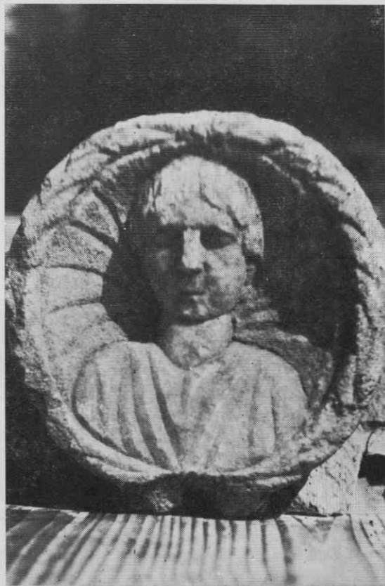
Rimski kamniti medaljon s portretom ženske, najden v Lahomnem pri Laškem. V muzejski zbirki v Laškem

Ob koncu tega kratkega pregleda arheoloških najdb iz Laškega lahko zaključimo, da je bilo Laško po doslej znanih podatkih naselje-