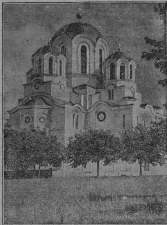
Cerkev v Oplencu, kamor so položili kralja Aleksandra I. k zadnjemu počitku.