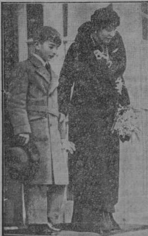
Nj. Vel. kralj Peter II. v spremstvu stare matere — romunske kraljice vdove.