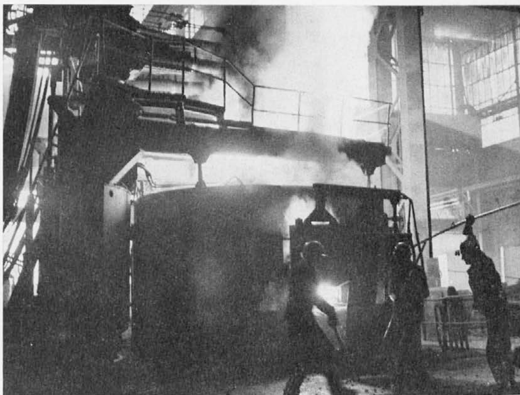
Pri izviru žlahtnega jekla

— začetek oskrbovanja železarne Štore z bogato brazilsko rudo,