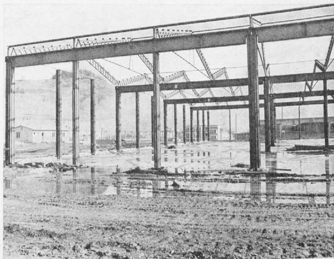
Raste nam nov obrat industrijskih nožev — zdaj je že pod streho

Hitro zgraditi in hitro producirati! Pred 17 meseci je pričela obratovati tovarna