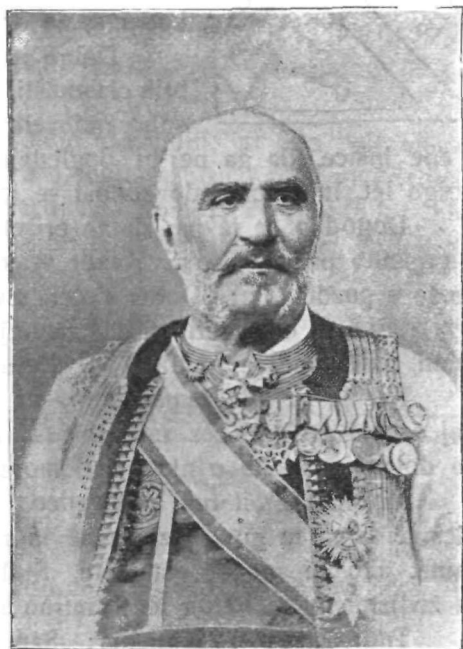
Črnogorski kralj Nikita.