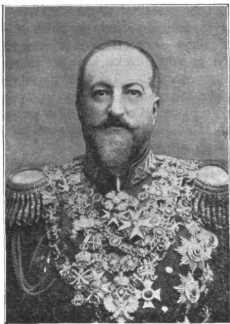
Bolgarski kralj Ferdinand.

Njen boj je razumljivo težak, čeprav ima več vojaštva, nego Bolgarija, Srbija, Grška in Črna gora skupaj. (O Turčiji pravijo, da ima nad 1 milijon vojaštva, Balkanska Zveza pa jih utegne imeti okolo 900.000). Vojaki vseh bojujočih se držav se drže krepko in junaško. Ves Balkan je v ognju, ves je oškropljen s človeško krvjo. Danes ne more nihče reči, čigava bo zmaga. Danes kličejo vsa človekoljubna srca: Bodi kmalu konec mesarskemu klanju! Naj da sreča junaška zmago našim trpečim slovanskim bratom!