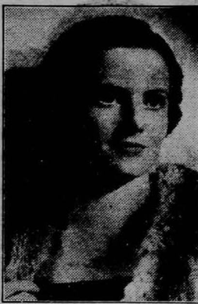
FRIEDA INESCORT V svojem zadnjem trumfu Samuel Goldwyn produkcije "The Dark Angel"

Tukaj je hollywoodska tajna! Večina lepih filmskih zvezdnice pije mleko... kajti mleko ohranja njihovo živahnost, ne da bi dodalo postavi težo.