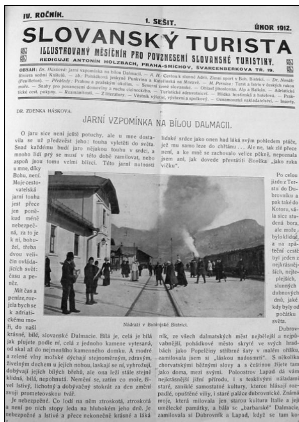
Kolodvor v Bohinjski Bistrici na naslovnici češkega turističnega glasila. (Slovanský Turista, 1912)

Cetudi je bil torej Bohinj po eni strani verjetno še daleč od kozmopolitskega (zimskega) letovišča, se je po zaslugi zveznih in lokalnih dejavnikov dobro vklopil v kompleksna družbenopolitična, ekonomska, vojaška, športna, idr. sodobna gibanja, skozi katera se je dokazal kot prvo izstopajoče slovensko zimsko turistično središče.