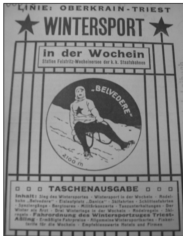
Naslovnica turistične propagandne brošure o zimskih športih v Bohinju. (Wintersport in der Woche in, 1910)