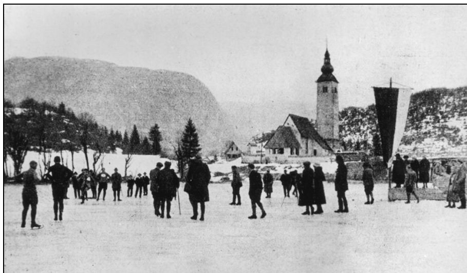
Drsalci na pomrznjenem Bohinjskem jezeru. (Sport, 25. 3. 1921)

celo o posebni skakalnici, približno z leti 1907–1908, ko na Slovenskem veliko priljubljenost pridobiva sankaski šport pa postaja jasno, da Bohinj svojega paradnega konja zajaha s športnim sankanjem.