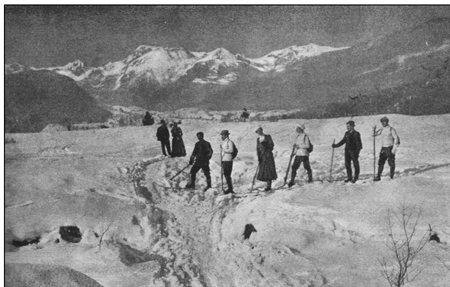
Smučarska družčina na turi po bohinjski okolici. (Sport, 15. 1. 1921)