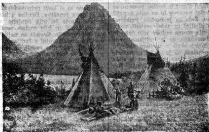
Indijansko taborišče s šatori ob jezuru

pogorelcev so bila skalpirana. V naslednjem tednu so nato propadle v gorečem tramovju vse kolibe belih, ki so prebivali v dolini »lepe reke«. Kornstalkovo povelje se je glasilo, da je treba vse odrasle belce pomoriti, vse otroke pa spraviti v ujetništvo. Toda maščevalni in krvoločni Šavani, razdraženi po lastnih izgubah, navadno tudi otrokom niso prizanašali. Posadka trdnjave ob brzicah reke Ohajo je bila izvabljena od nezatnega števila rdečkožcev k izpadu. Čim so se beli bojevniki prikazali na svetlo, je zaživel sleherni grm in naenkrat je planilo nad bele bojevnike nešteto Indijancev. Beli siromaki so morali spoznati grozoto indijanske vojne umetnosti: padli so v zagato. Hoteli so v grozi in strahu pobegniti nazaj v trdnjavo. Toda že je pritisnil za njimi Katahekasa s svojimi možmi. Nihče izmed posadke ni ostal živ. Petintrideset mož je obležalo. Ime poveljnika Ka-