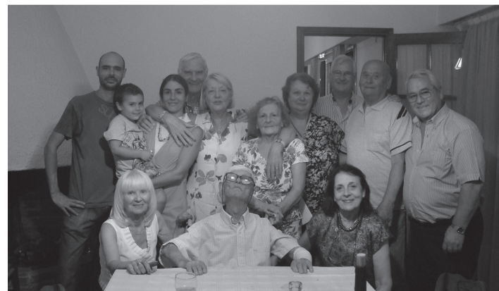
Stoletnik v krogu svoje družine