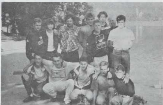
Nogometaši iz Slovenske vesi na Blejskem jezeru.

Nogometaši so na atletskem stadionu v Kranju dopoldne odigrali prvo tek-