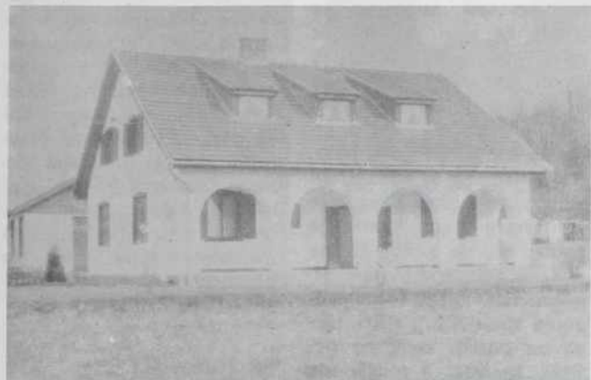
Hiša v Slovenski vesi, ki je lepo prilagojena pokrajini in nas spominja na stare kmečke hiše v Porabju.