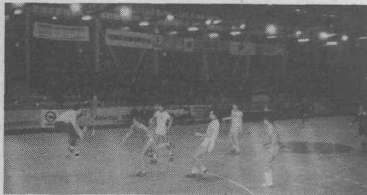
Prizor s tekme Kolinska-Slovan: Partizan Bjelovar

Zanimanje za tako rekreacijo je zelo veliko, saj se je prijavilo kar 22 ekip, največ iz delovnih organizacij in klubov naše občine, nekaj pa tudi od druge. Moštva, ki so se samostojno formirala in prijavila, že tekmujejo. Pozivamo pa jih, da se čimprej povežejo s krajevno skupnostjo, v kateri živijo.