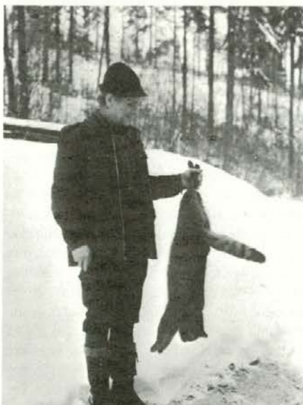
Lovec s svojim plenom - Foto: I. Lekše