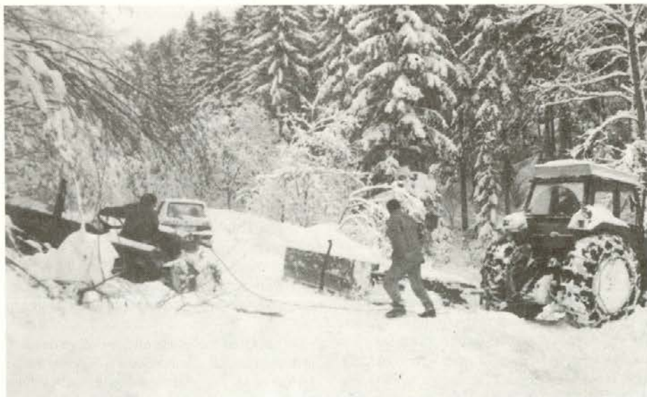
Letošnja muhasta zima dela precej težav na gozdnokamionskih cestah, kjer je treba ceste redno plužiti. Zaradi debele snežne odeje ali pa zametov se večkrat zgodi, da med pluženjem traktor zapelje s ceste. Tu je pač treba pomagati.