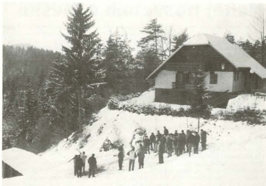
Novoletno lovsko srečanje v Doliču