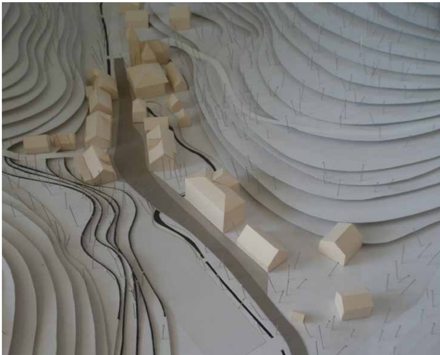
Slika 5: Maketa prenove naselja Lemberg [Jerneja Kranjec].