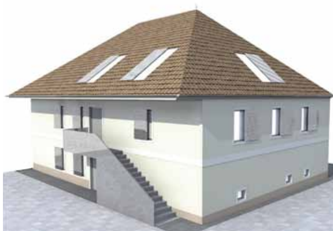
Slika 6: Prostorski prikaz prenove [Alen Gaube, Jerneja Kranjec].