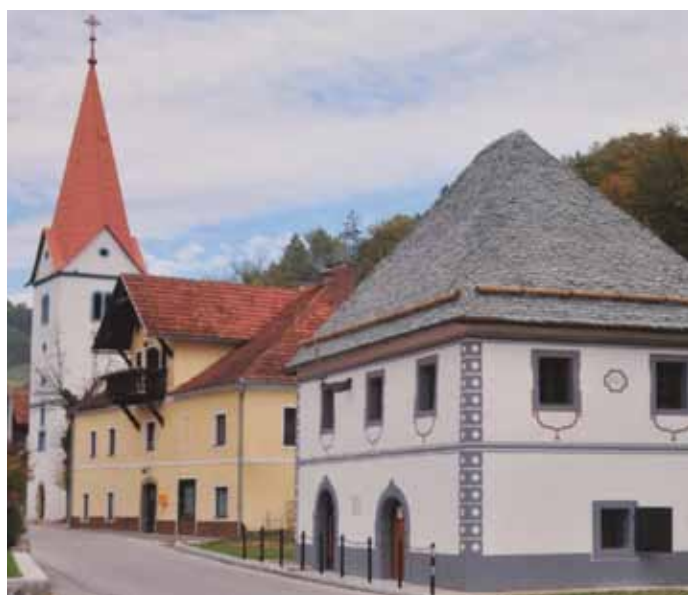
Slika 7: Lemberg 2011, pogled na obnovljeni Rotovž [Jerneja Kranjec].