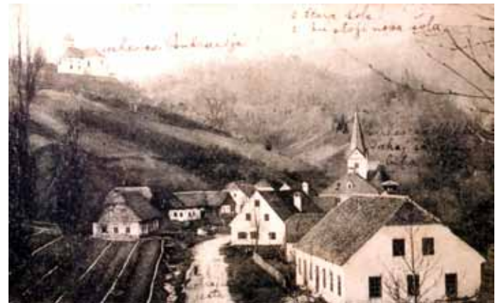
Slika 2: Lemberg na razglednici leta 1902, neznan avtor.