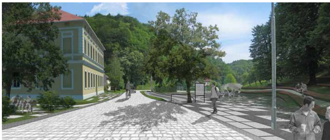
Slika 4: Fotomontaža možnega razvoja, pogled na kulturni center in park z amfiteatrom [Erika Hrovat].