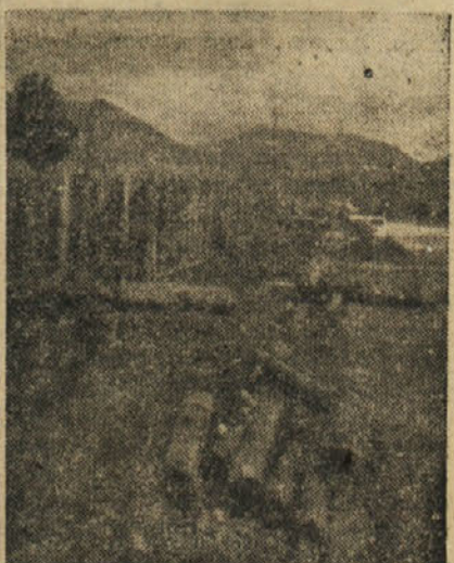
Na obeh straneh magistrale Nove Gorice grade odtočne kanale

brigadi je delegacija AFZ iz Bele krajine podarila lepo vezano zastavico. Večera je bilo proglašeni večje število novih udarnikov, mnogo pa je bilo pohvaljenih. Skupno je bilo v dvomesečnem delu na gradilišču proglašeni 43 udarnikov, 110 pa je bilo pohvaljenih. V sklopu proslave so priredili tudi razstavo, kjer so prikazali regulacijo potoka Korena v miniaturi in uspehe fizičnega in kulturnega dela v grafikonih. Dan so zaključili s športnimi in kulturnimi medbrigadnimi prireditvami. P.