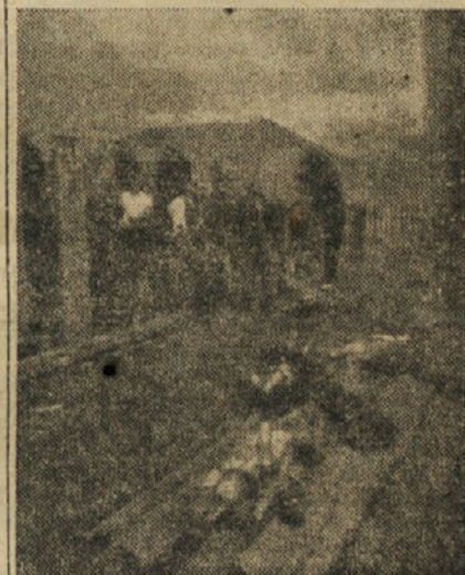
Prva brigada pri gradnji kanala je zgled smotno organiziranega dela