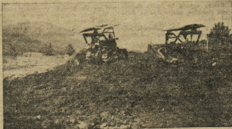
Buldožeri na delu

izpoljevanjem in razširjanjem brigadnega sistema na vseh delovnih mestih in s pojačanim tekmovanjem bomo operativni plan v mesecu juniju in juliju prekoračili za 10 %.