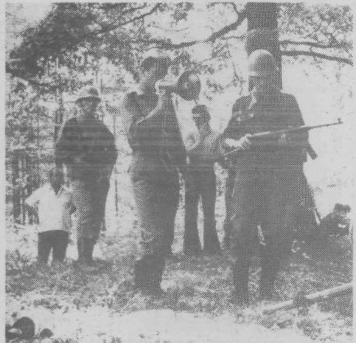
Razlaga o brzostrelnem orožju