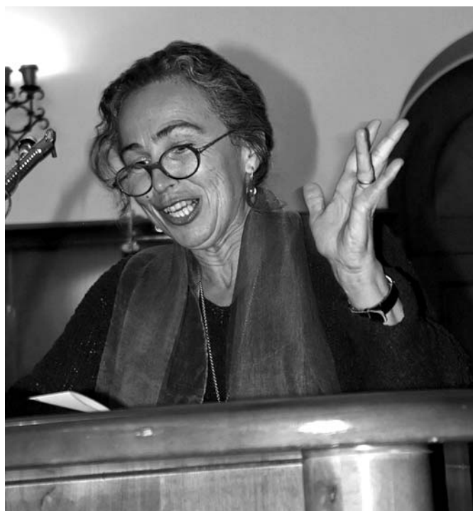
Govor Murkove nagrajenke.