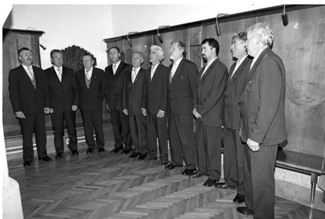
»Hruški fantje« so s pesmijo obogatili večer.