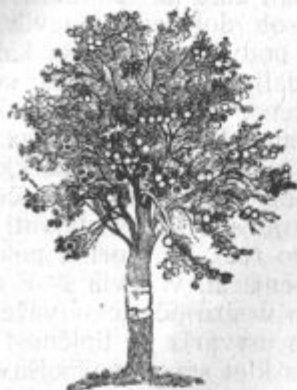
Pod. 33. Drevesni pas, namazan s klejem, ki ostane lepljiv.

Sedaj je še ves mesec čas, da se lotimo pokončevanja tega mrčesa, posebno po krajih, koder redno nastopa in dela veliko škodo.