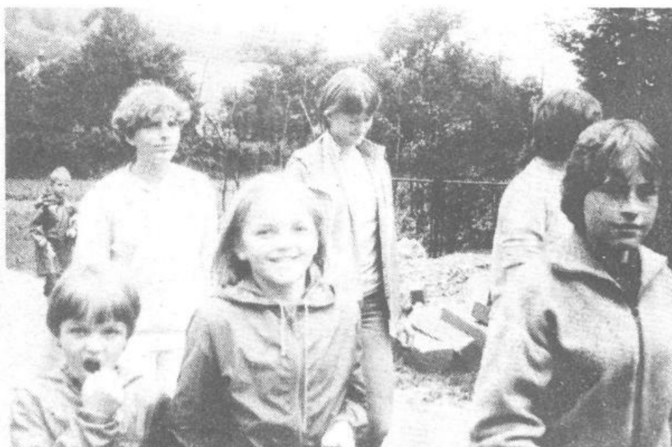
Kljub slabemu vremenu so bili mladi gosti iz Švedske zadovoljni

Vezi torej postajajo trdnješe in letošnji obisk iz Göteborga prav gotovo ni bil zadnji. Tako lepo je priti v domovino čeprav je Švedska že nekako postala druga domovina teh ljudi. Pa vendar. Povsod je lepo, doma je najlepše. Prijetni vtisi in gostoljubje Izancev ne bodo šli v pozabo in morda je ta »skok« v domovino spet obudil občutke, ki so z leti morda nekoliko zbledeli – ljubezen do domače zemlje, ljubezen do domovine, hrepenenje, ki ga morajo zdomci – ne samo na Švedskem, ampak tudi povsod drugod – potisniti nekoliko vstran, da lažje živijo, ki pa vendar nikoli ne ugasne.