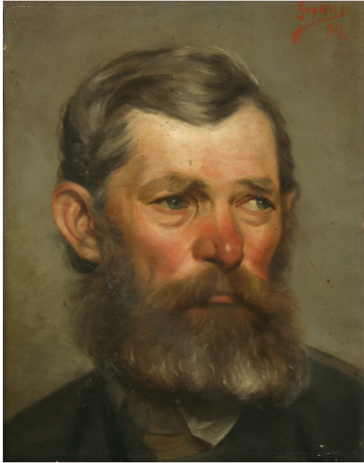
Kmet iz Sorice , 1894, olje/papir, 36.6 x 28.1 cm, Loški muzej Škofja Loka.

(1894) in Vrtnice (1894). Večina omenjenih del je verjetno nastala, ko se je Grohar med počitnicami vračal v Sorico. Vidi se, kako so ga prevzeli obrazi domačih ljudi in narava. Na portretih se kaže značilen soriški obrazni tip, Grohar se sprosti v barvi, obraze podaja vse bolj naturalistično, psihološko poglobljeno, jih ne idealizira. V zgodovino se je sicer zapisal kot mojster krajine, a prav v teh podobah ljudi je izbrusil slikarsko potezo, z njimi je začel umetniško pot. Vidi se, kako ga je zanimala ekspresija človeškega izraza, zlasti blizu mu je bil žanrski portret. Pogledi, odsevi, sij in barve kože delujejo kot abstraktne mentalne krajine, kjer je razvijal svoj slog, ki ga je nato dokončno prenesel v impresije krajin.