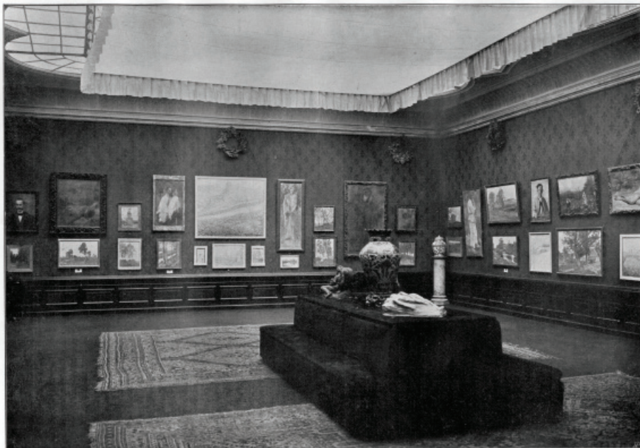
SLOVENSKA UMETNIŠKA RAZSTAVA NA DUNAJU.

Fotografija razstave kluba Sava v Salonu Miethke na Dunaju, leta 1904.