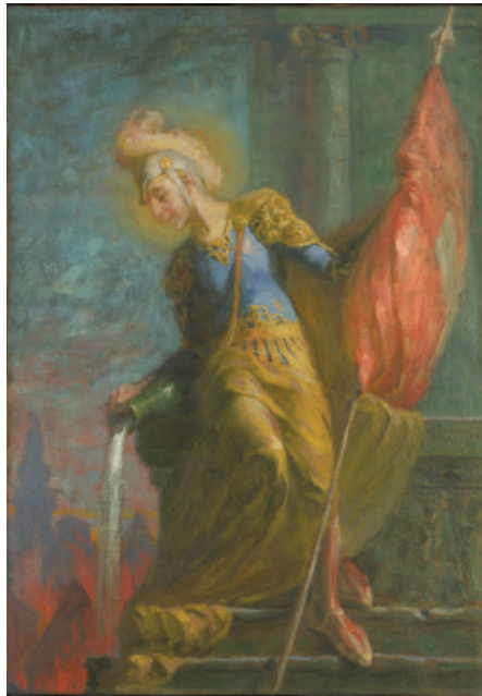
Sv. Florijan , 1898; olje/platno, 100 x 70 cm, Loški muzej Škofja Loka.