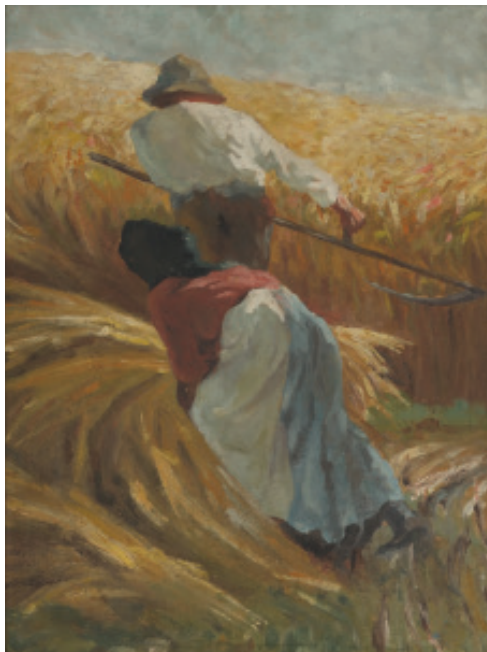
Žetev , 1900; olje/karton, 31,5 x 24,3 cm, Loški muzej Škofja Loka.