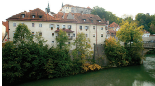
Stara Kasarna - Jesiharna, eno od nekdanjih bivališč Ivana Groharja.

Leta 1895 je Grohar dokončal zadnji letnik graške šole. Dokument, ki je tudi na razstavi, 3 kaže, kako uspešen je postajal kot slikar.