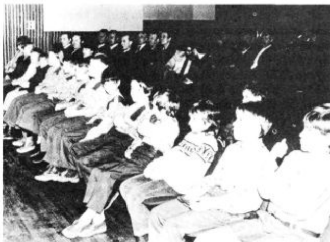
Z občnega zbora bistriških gasilcev

Članstvo je v lanskem letu posvetilo največ pozornosti pripravi gasilskih ekip na razna tekmovanja, občinska, regijska in republiška. Pri gradnji gasilskih domov so bili prizadevni v Podgradu in na Javor – Baču, kjer je bila otvoritev gasilskih domov in kjer je bilo poleg dodeljenih sredstev opravljenega veliko prostovoljnega dela. V Jelšanah so pričeli z gradnjo gasilskega doma, v Vrbovem pa so si člani te gasilske enote uredili gasilsko orodjarno v prostorih stare osnovne šole. Ilirskobistriški gasilci so svojo tehnično opremo dopolnili še z novim tehničnim gasilskim vozilom. Veliko storjenega je bilo na preventivnem področju, saj so prostovoljni gasilci formirani v preventivne komisije, pregledali preko 600 stanovanjskih in drugih zgradb v občini.