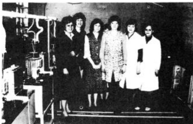
Delavke ob tekočem traku, ki pakirajo termostate

Potreba po ustanovitvi obrata je 1979. leta organsko zrastle iz pomanjkanja delovne sile v Cerknem. ETA se je s Plutalom sporazumela za najetje prostorov v stari stavbi na Trnovem in proizvodnja je hitro stekla. Od 45, kolikor je bilo delavk zaposlenih takoj ob odprtju obrata, se je njihovo število do konca leta povzpelo na 70 in kasneje na