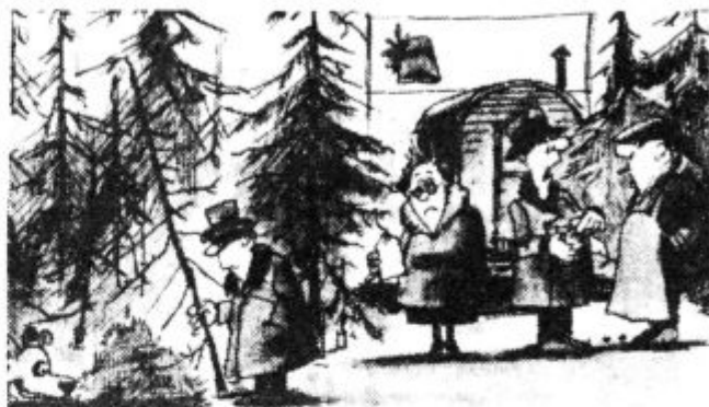
»Koliko? Čujte, jaz ne mislim kupiti gozda, temveč eno smrečico!«

– v mesecu marcu so se uresničile stare želje naših krajanov, saj je začel delovati rentgenski aparat v našem zdravstvenem domu. Z novim rentgenom že slikajo pljuča in kosti, v prihodnosti, ko bo prihajal še ustrezeni specialist, pa se bo vršilo še slikanje želodca in drugih organov. Z navedeno pridobitvijo bodo tako odpadla draga in zamudna potovanja v kraje izven občine.