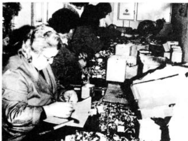
Oddelek montaže termostatov

V aprilu leta 1979 je v Ilirski Bistrici odprla poslovno enoto tovarna elektrotermičnih aparatov ETA iz Cerknega. Ta delovna organizacija, ki se je v povojnih letih razvila iz manjšega elektromontažnega podjetja Rempod, temelje pa si je ustvarila v partizanskih delavnicah NOB, združuje danes 6 temeljnih organizacij združenega dela in skupne službe. Njen glavni proizvod in osnovni artikel so grelni plošče, pa tudi cevni grelci in termoregulatorji vseh vrst. Temeljna organizacija združenega dela Termoregulator, ki je ustanovitelj poslovne enote v Ilirski Bistrici, zaposluje skupaj 456 delavcev, od tega 81 v Ilirski Bistrici, nekaj pa tudi v Logatcu in Poreču.