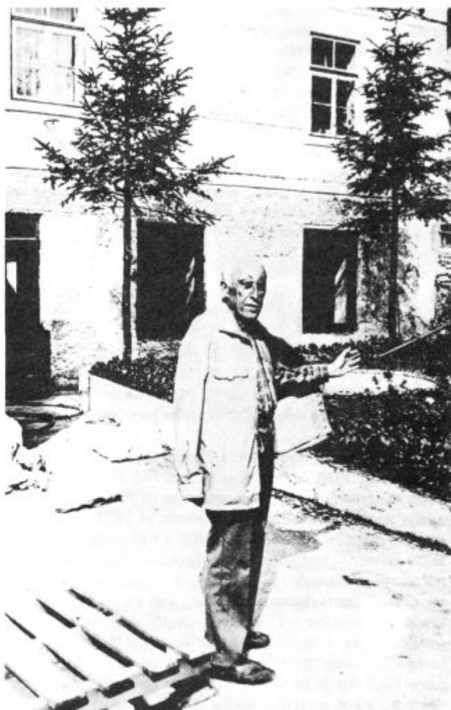
Vodstvo Tovarne organskih kislin je dojelo pomembnost hortikulturne ureditve okoli tovarniških objektov; urejene zelenice vplivajo na razpoložanje in zdravje delovnega človeka. Lansko leto je TOK za ozelenitev in hortikulturno ureditev porabil 370.700,00 din.

Mesto Ilirska Bistrica ima vse pogoje, da lahko postane eno najprivlačnejših mest na Slovenskem. To Ilirski Bistrici omogoča izredno ugodna zemljepisna lega; ilirskobistriška dolina predstavlja vrata, preko katerih se poleti zgrinjajo množice turistov, ki hite iz zameglene in preindustrijalizirane srednje in severne Evrope na sinji Jadran. Zaledje Ilirske Bistrice je snežniški masiv, ki se bohoti s prostornimi gozdovi jelke, smreke in bukve ter se ponaša s čudovito floro: planiko, slečem, gorskim brinom in drugim. Sam očak Snežnik pa je odet v temnozelen plašč rušja. Žal