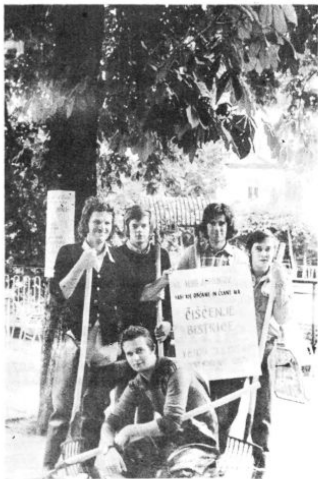
Klub študentov Ilirska Bistrica l. 1975 pri prostovoljnem delu – čiščenje rečice Bistrice. Današnja mladina bi jih morala posnemati.