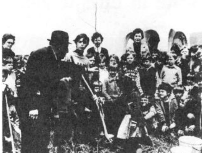
Hrib svobode spomladi leta 1980.

Naša politična in kulturna naloga je in ostane, da ohranimo lepoto krajine, čuvamo zelene površine in se borimo za čisto, zdravo okolje.