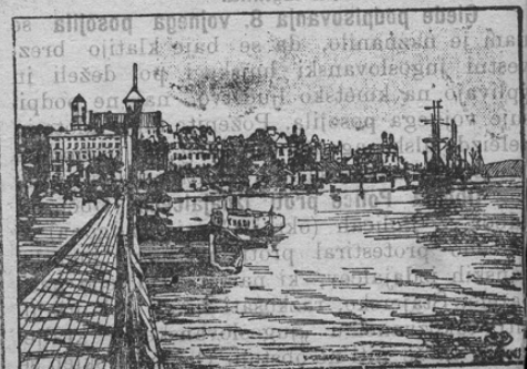
Ansicht von Wiborg.

zavzela Finska armada. Mesto je utrjeno i velikega vojaškega namena.