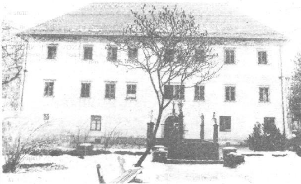
IZ KS POLHOV GRADEC