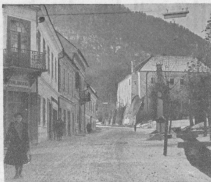
Motiv iz Slovenskih Konjic

lijo, lahko rečemo, v vseh 39 mladinskih aktivih, je enako. Delavska univerza sicer ima lep program, je pripravljen pripraviti