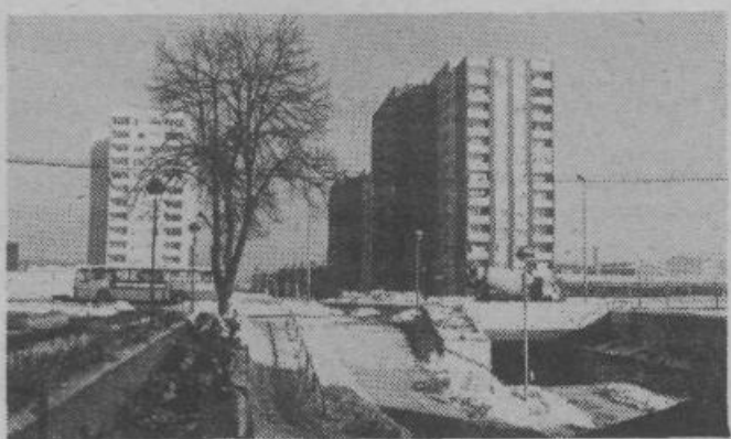
Zimski pogled na stolpnice ob Litijski cesti