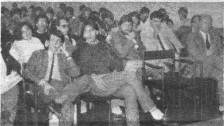
Programsko volilna seja mladih v Centru

Iz programskih usmeritev povzemamo, da so pred mlade v delovnih organizacijah prav tako pa pred mladinsko organizacijo nasploh naloge, za doseganje boljših pogojev gospodarjenja. Posebno pozornost bodo posvetili tudi usmerjenemu izobraževanju in boljšemu dijaškemu in študentskemu standardu. M.I.