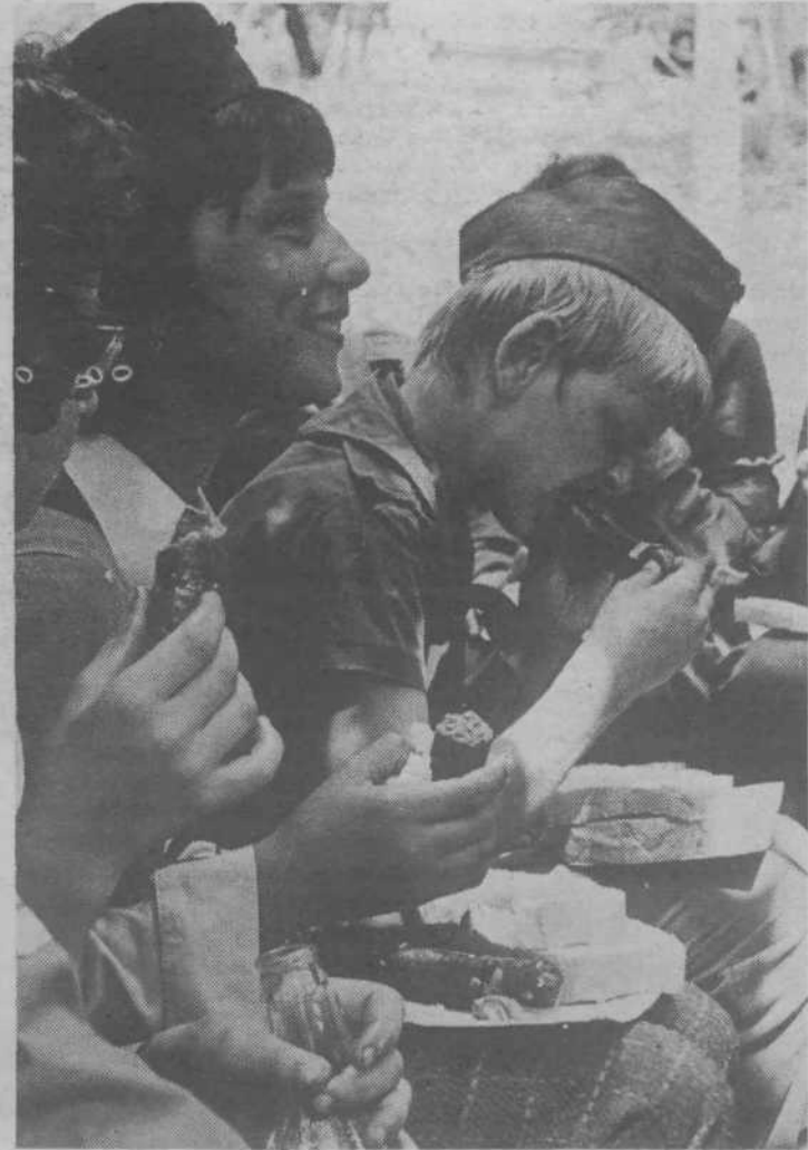
Malo se oddahnemo potem pa spet na pot