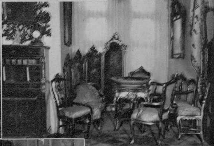
Rokokojski interieur iz srede 18. stol.