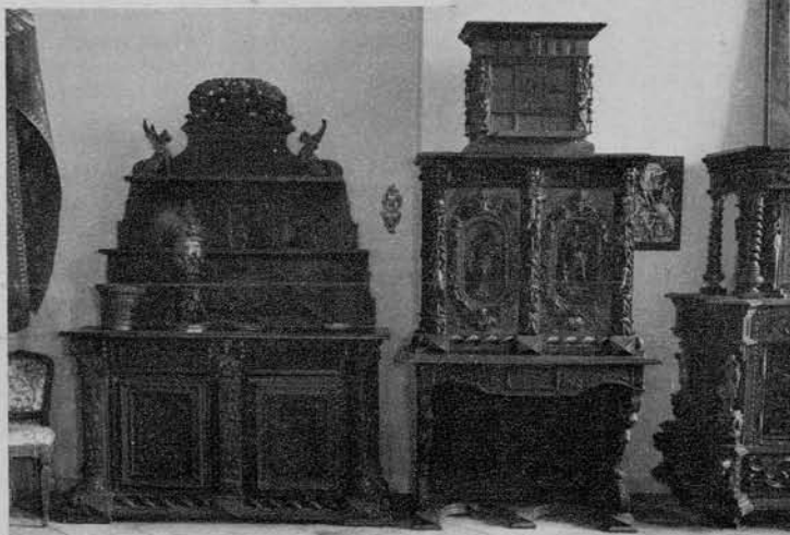
Gotska omara iz konca 15. stol.