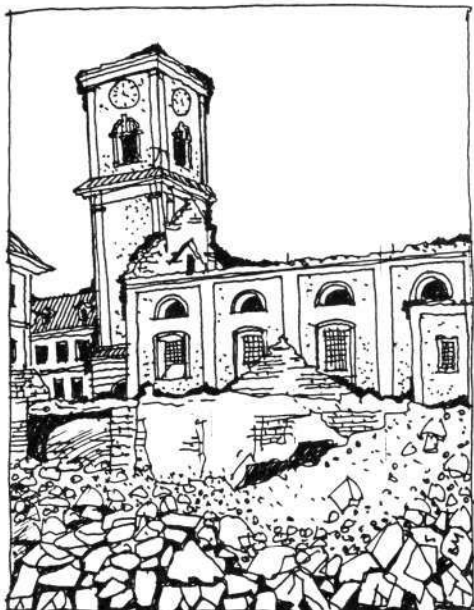
CERKEV SV. BARBARE PO BOMBARDIRANJU

Tudi spomenik rudarju se je moral prometu umakniti v park. Njegova prvotna postavitev mi je bila vedno uganka. Kako je kipar TONE KRALJ določil lokacijo? Danes, ko sem natančneje proučil lokacijo cerkve, je jasno, da je postavil spomenik točno v center trga in v osi vhoda v cerkev. Po zrušitvi cerkve se je