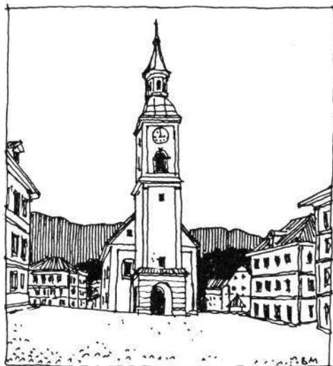
CERKEV SV. BARBARE PRED PORUŠITVIJO

mu prostoru v kotlini. Cerkev je poleg trgovinskih, stanovanjskih in upravnih objektov oblikovala trg v štirikotni obliki, dimenzije 70 x 60 m. Trg je imel isto vsebino kot grški »agora« ali rimski »forum«. Povezan je bil z vso Idrijo, seveda z majhnimi in ozkimi ulicami. S trga je bil in je še vedno ostal lep pogled na grajsko pročelje. Prostorsko sta se pročelji gradu in cerkve pogovarjali in dopolnjevali. Te vrednote danes ni več. Orientacija trga je zasnovana v smeri V-Z. Dostopen je z vzhodne strani iz Rožne in Rozmanove ulice, z zahodne strani pa iz Prelovčeve ulice. V smeri S-J je trg na severni strani dostopen po Študentovski ulici, na južni pa preko Ljubljanske ulice vodi na »Stari plac«. Orientacija trga, njegova vsebina in dostop me spominja na oblikovanje rimskega mesta z znamenitim mestnim križem cest DEKUMANUM MAX. V-Z in CARDO MAX. S-J. Prezreti pa ne smem še ene zanimive in enkratne povezave: med trgom pred sv. Barbaro preko stopnic in podhoda pod »Magazinom« na »Stari plac« in nato preko zidanega mostu nad potokom Nikavo do rudniškega vhoda »sv. Antona« iz leta 1500.