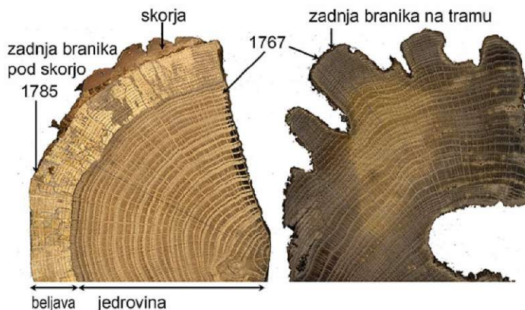
Slika 5. Pomen beljave za interpretacijo datiranja. Hrastov les na levi vsebuje beljavo in skorjo, datum zadnje branike pod skorjo je 1785, zadnja branika je popolna, drevo je bilo posekano v času od jeseni 1785 do pomladi 1786. Les na desni nima niti skorje niti beljave. Datum zadnje branike je 1767. Ker manjka celotna beljava, lahko ugotovimo samo to, da je bilo drevo posekano vsaj 15 let po letu 1767.

Figure 5. Importance of sapwood for interpretation of dating. Oak on the left contains sapwood and bark, the date of the last ring below the bark is 1785, the last ring is complete, the tree was felled in the period from autumn 1785 to spring of the 1786. Wood on the right does not have bark or sapwood. The date of the last ring is 1767. Since the bark and the entire sapwood are missing, we can conclude that the tree was felled at least 15 years after the year 1767.