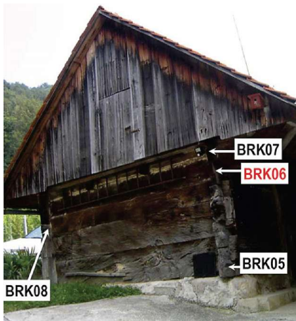
Slika 1. Berkovičev hram in delovne številke brun, iz katerih smo odvzeli izvrtke za dendrokronološko datiranje. Bruno BRK06 je imelo na delu na vhodnih vratih vrezano letnico 1722.

Figure 1. The Berkovič wine cellar and codes of beams from which the cores were taken for dendrochronological dating. The beam BRK06 contained the engraved number 1722 on the part above the main door.