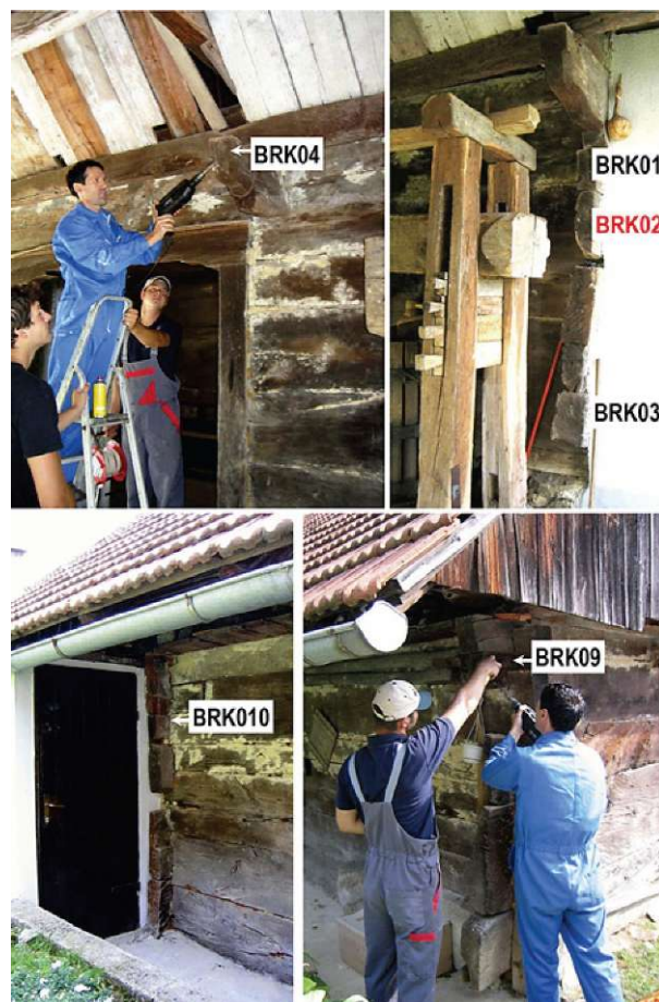
Slika 2. Berkovičev hram z mesti odvzema dendrokronoloških vzorcev. Bruno BRK02 je imelo največ branik beljave. Figure 2. Berkovič wine cellar with locations of beams selected for dendrochronological dating. The beam BRK02 contained the greatest number of sapwood rings.