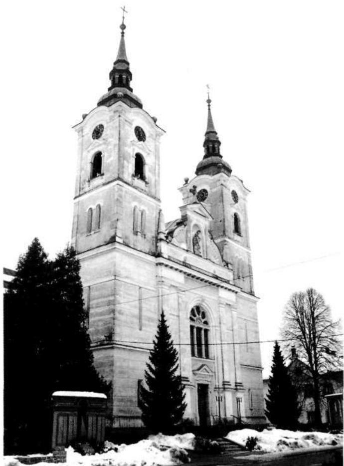
Župnijska cerkev sv. Martina v Žireh