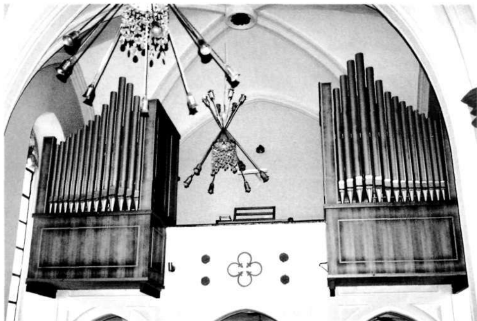
Jenkove orgle iz leta 1984

značilni primer gotsko slikanega svetišča za sredo 15. stoletja, prezbiterij pa je vrhunec okrašenega kranjskega prezbiterija. Cerkev bogatijo slike Jerneja iz Loke iz 16. stoletja in krasni zlati oltarji, ki jih je izdelal Jamšek.