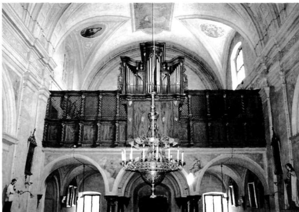
Rumplove orgle iz leta 1935