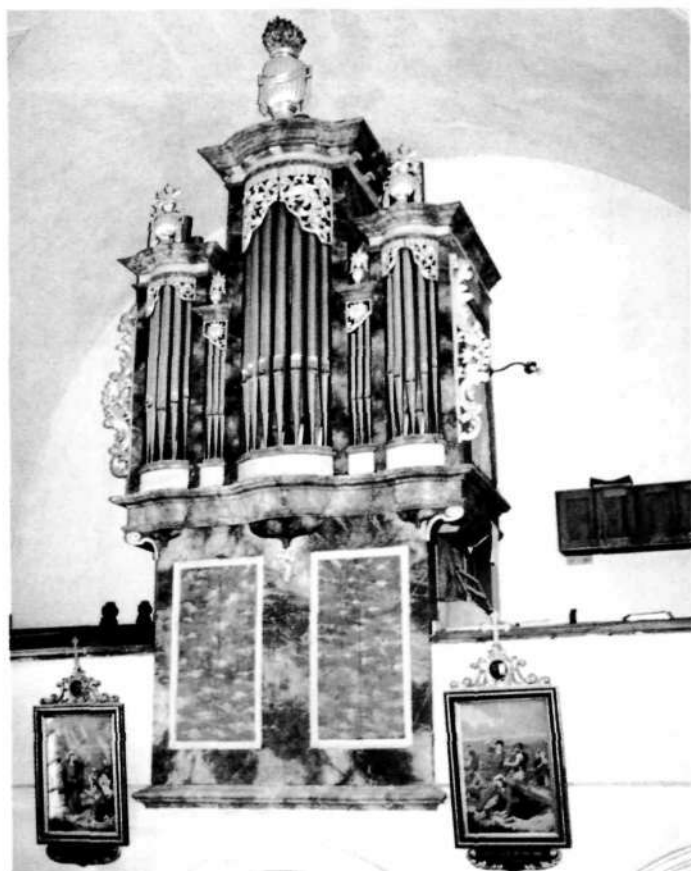
Jenkove orgle iz leta 1972