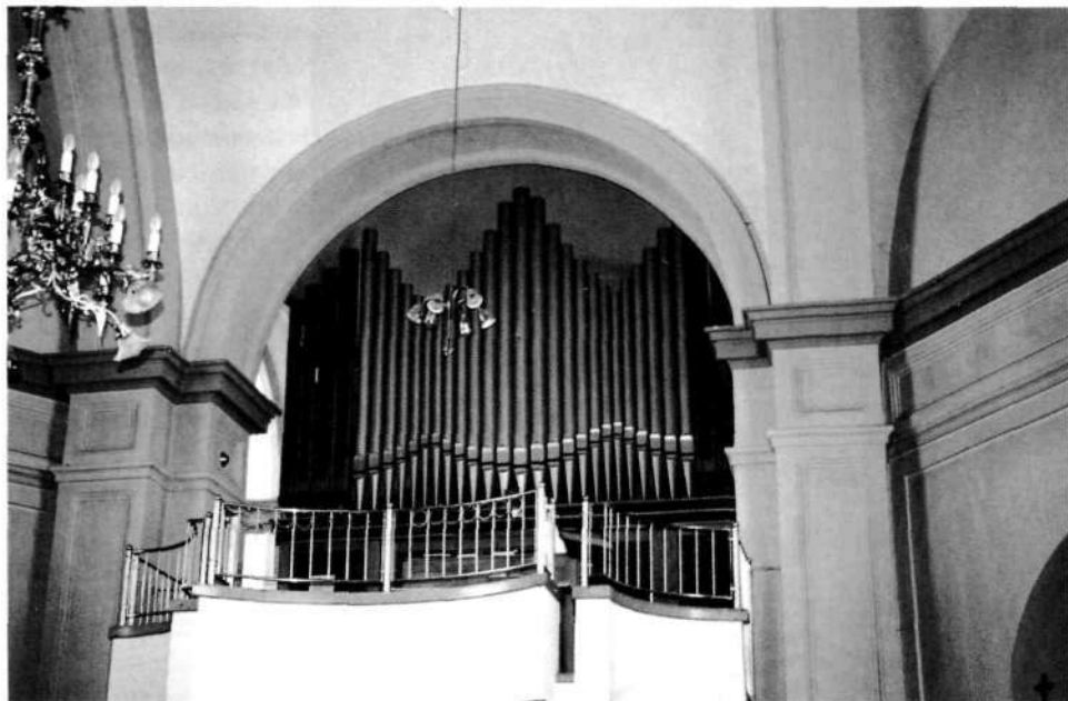
Jenkove orgle iz leta 1962