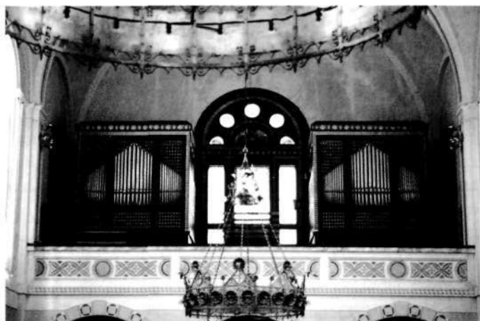
Milavčeve orgle iz leta 1914