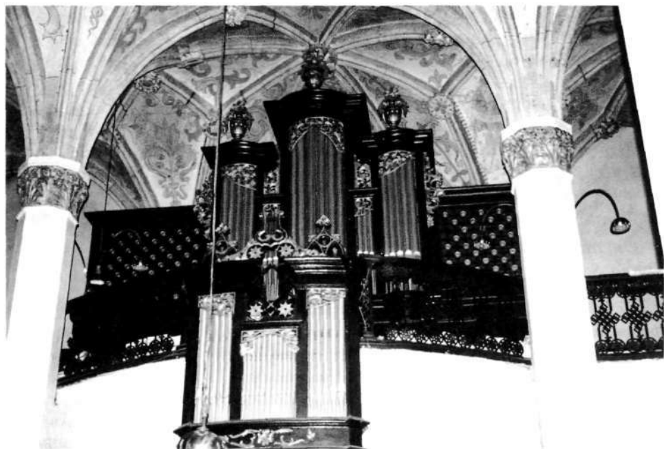
Jenkove orgle iz leta 1932

Med režočimi izpremeni je najočitnejša koncertna viola 8', iz dveh vrst piščali: iz široke gamba in ožje, tudi že labirane viole da gamba; mojster je resnično dosegel široki, zgneten, presenetljivo zadeti violin glas; v nižjih legah zveni ko gost orkestralni cello. – Salicional 8' je na koru, ker je tik za ušesi, nekoliko režoč; v cerkvi pa kar pravešen. – Dolce 8' – kakor mora biti – v zlati sredi med goslimi in flautami. – Vox coelestis 8', nekoliko višje uglašena, je šumeča, pa zelo nežna eolna. Oba izpremena se zlivata v tak izrazit nežen, pa hkrati poln glas, ki mora celo načelnega nasprotnika tega izpremena zadovoljiti. To ni tiste vrste vox coelestis, ki poslušarca vznemirja, ko mu kakor komar s svojim tenkim glasom nadležno na uho brenči, da se je človek boji, še preden jo sliši, marveč je iz dveh vrst sestavljen izpremen, ki zveni kakor polne orgle iz velikanske dalje in je prav zaradi svoje prtajene polnosti na vso moč prijazen in poraben. – Dulciana 4' je tiha, ponižna stvarca, pa vsak drug izpremen silno poživi, kar pozlati. – Miksturi sta dve: v I. manualu je peterovrstna, zelo obzirna, polna; v II. manualu svetlejša, bolj živa. – Jezičnik tromba 8' je narejena na francoski način, zelo ostra, učinkovita, prodirna.