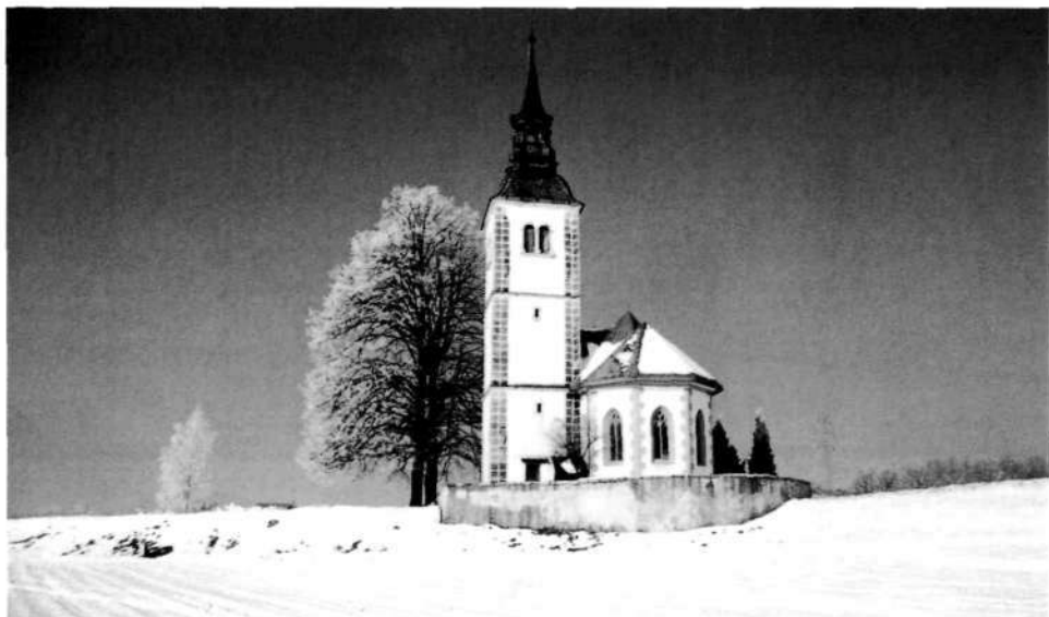
Župnijska cerkev sv. Janeza Krstnika na Subi pri Škofji Loki

Župnijska cerkev sv. Janeza Krstnika je gotska, z obzidjem obdana zgradba, ki je prvotno imela raven strop. Omenjena je leta 1450 kot kapelica, kjer je zdaj prezbitertij. Leta 1747 so postavili sedanji zvonik, leta 1893 pa so cerkev obokali. Cerkev je