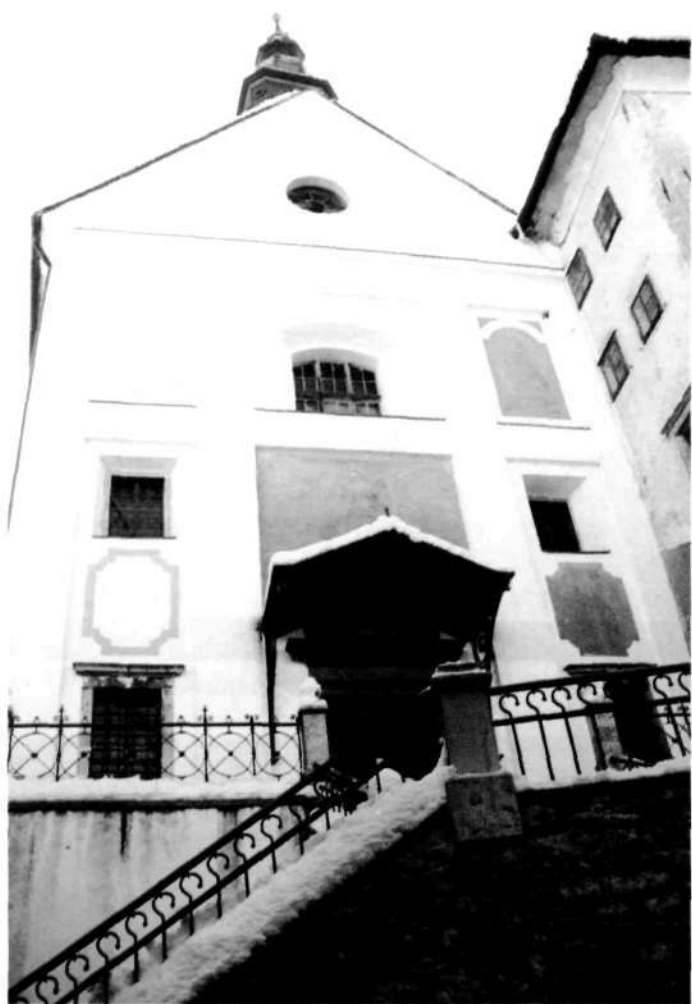
Uršulinska cerkev Marijinega brez- madežnega spočetja v Škofji Loki

pripelje nekako v sredino 19. stoletja. Glede dispozicije registrov si skorajda ne moremo več pomagati, saj je bil ta čudovit instrument tako predelan, da iz obstoječega stanja skorajda ne moremo več razbrati prvotne zamisli. Romantični registri, ki sta jih narekovala moda in okus preteklih desetletij, kaže zvočno podobo tega klasicistično zasnovanega glasbila ... Če primerjamo obliko pročelja orgel iz zgornjega Tubinja in uršulinske cerkve v Škofji Loki, bomo nemara opazili še druge podrobnosti. 11