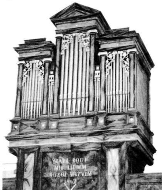
Rojčeve orgle iz leta 1852

Rojčeve orgle je jeseni 1994 obnovil Tomaž Močnik.