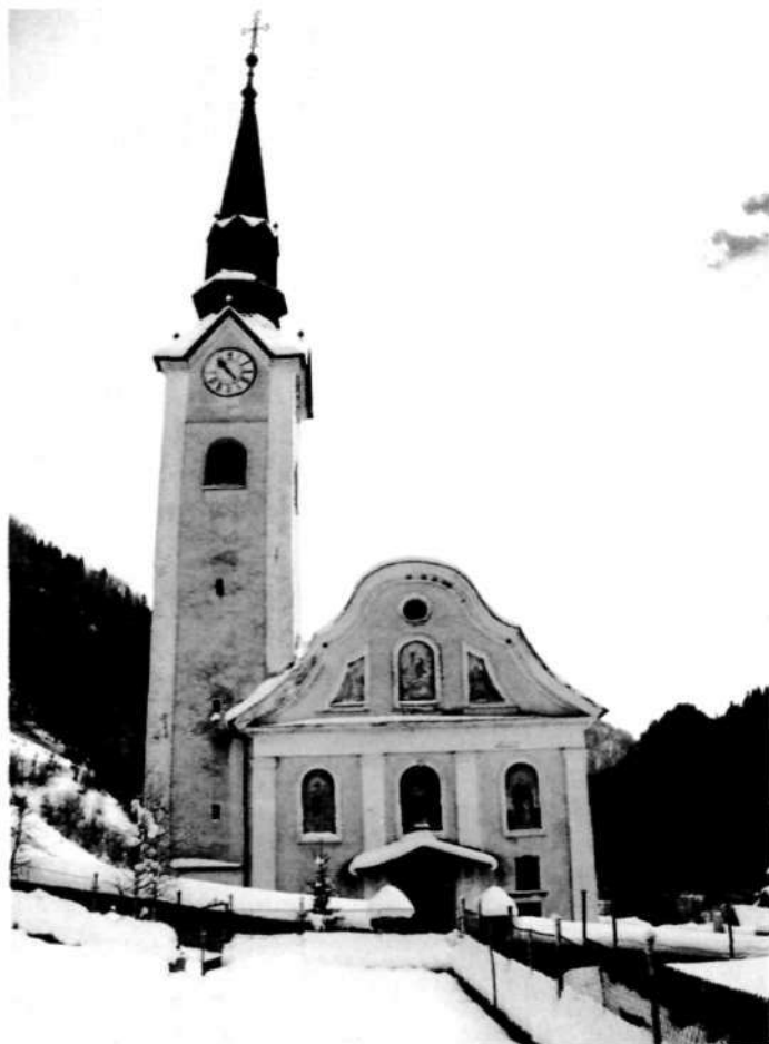
Župnijska cerkev Marijinega vnebovzetja v Zalem Logu