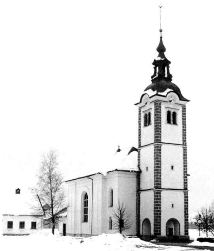
Župnijska cerkev sv. Urba v Žabnici