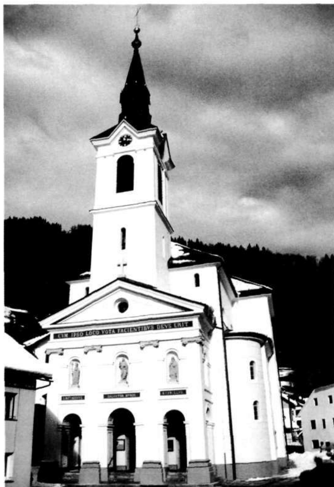
Župnijska cerkev sv. Antona Puščavnika v Železnikih

biteriju so delo Ljudevita Grilca, oltarna slika sv. Antona Janeza Wolfa, stranski oltarji Janeza Gosarja.