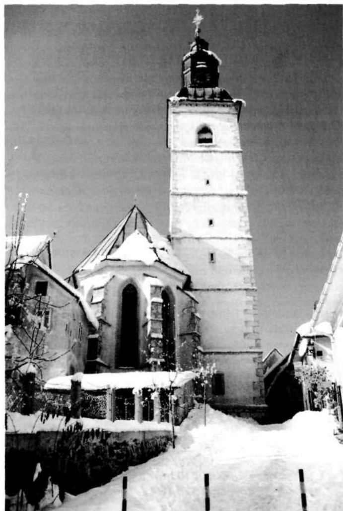
Župnijska cerkev sv. Jakoba v Škofji Loki