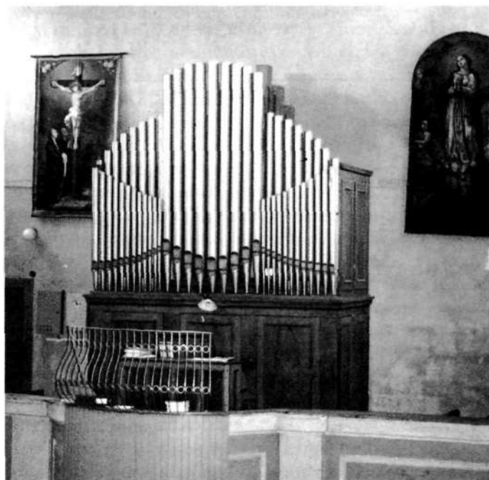
Jenkove orgle iz leta 1938

«Zdaj pa bi utegnil morebiti kdo še reči: Popisal si nam orglarjevo, slikarsko in kiparsko delo, povej nam vendar tudi, koliko je vse to stalo, in kdo je dal za to potrebni denar? Ker je stvar zgodovinska in bo zanimala čez leta morebiti naše tukajšnje potomce še bolj kot sedanji rod, naj odgovorim tudi na ta vprašanja. Cele orgle, kakor se kažejo sedaj ogledovalcem, veljale so dva tisoč goldinarjev in petdeset krajcarjev in pet frankov v zlatu. Za stroške se je izplačalo: