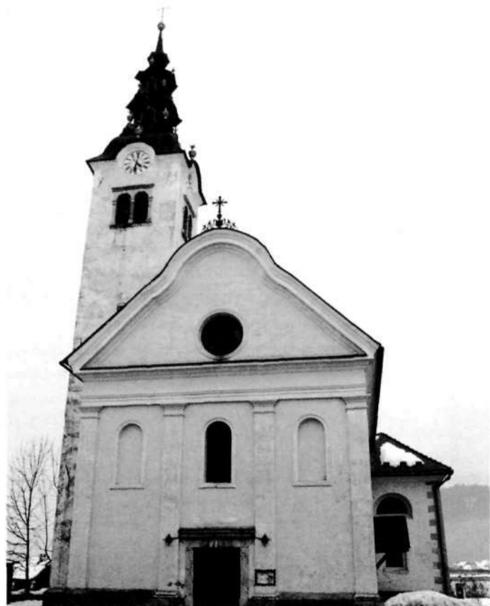
Župnijska cerkev sv. Janeza Krstnika v Gorenji vasi

Župnijska cerkev sv. Janeza Krstnika, ki ima stropne slikarije iz druge polovice 17. stoletja in Wolfovo sliko sv. Janeza, se prvič omenja šele leta 1623. Sedanja stavba