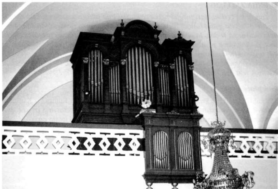
Zupanove orgle iz leta 1892

je bila zgrajena leta 1752, povečana po požaru leta 1862. Posebno lep je pozno-baročni oziroma rokokojski zvonik. Veliki oltar je še v baročni tradiciji prišel iz Šubičeve delavnice. V stranskem oltarju je Wolfova slika Matere Božje. V podrti lopi je stala slika sv. Antona, po katerem je dobil kraj in del Žirovskega vrba svoje ljudsko ime.