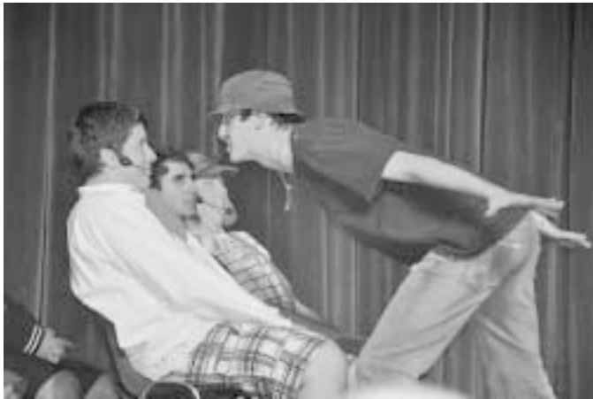
Videli smo kar nekaj talentov