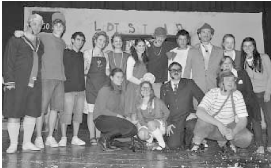
Vsa mlada igralska družina