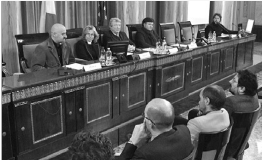
Z včerajšnje predstavitev tržaške spletne gospodarske agencije

Z novim projektom želijo informacije o tržaškem gospodarstvu posredovati širši javnosti