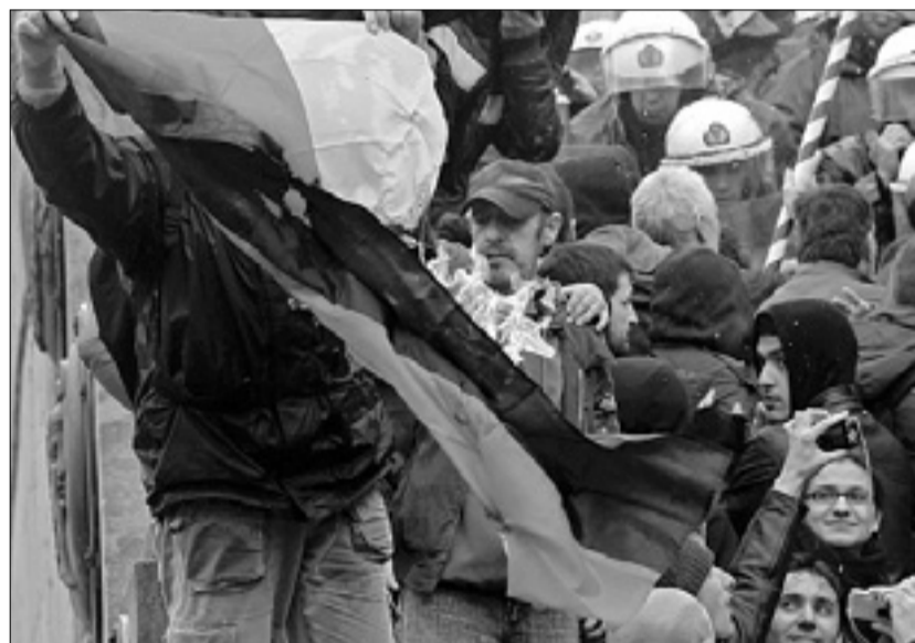
Protestniki v Atenah so demonstrativno sežgali nemško zastavo

Grška vlada je v ponedeljek popoldne sporočila, da so sprejeli zahteve upnikov za zmanjšanje delovnih mest v javnem