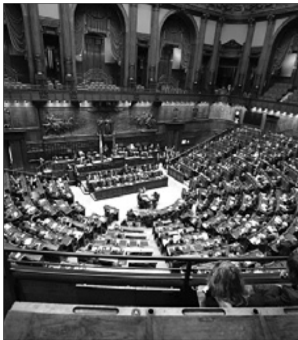
Zasedanje poslanske zbornice

Tako se pod streho tehnične Montijevje vlade vzpostavljajo stiki med strankami, ki bi bili še do nedavnega nepojmljivi. Videli bomo, kaj bodo obradili. Voditelj UDC Pier Ferdinando Casini se je v teh dneh zavzel za to, da bi tudi po Montijevi vladi skušali obnoviti sedanjo veliko koalicijsko, češ da do konca sedanje zakonodajne dobe ne bo mogoče izpeljati vseh reform, ki jih Italija krvavo potrebuje in za uresničitev katerih ne bi bila zadostna navadna politična večina. Toda sekretar Demokratske stranke je že povedal, da se bo morala italijanska politika po sedanji izredni fazi v novi zakonodajni dobi vrniti na normalne tirnice.