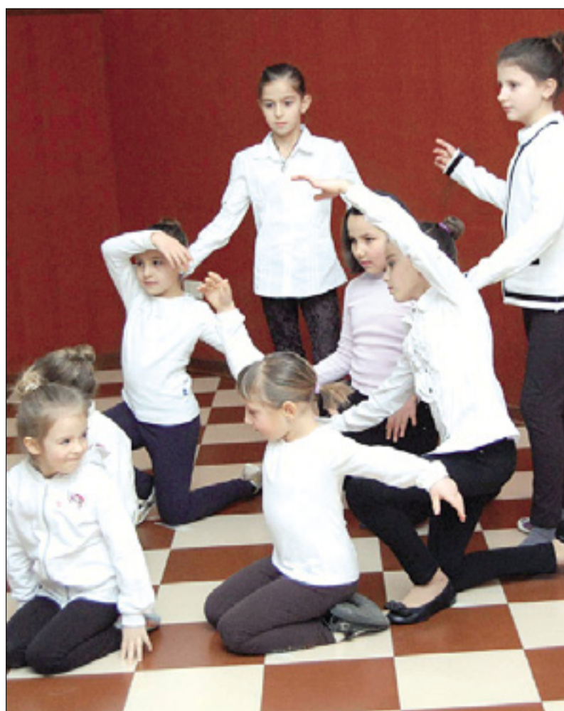
Udeleženci srečanja (levo); otroška plesna skupina Danica (zgoraj)

Oktet Sv. Mihaela prihaja z Vranskega v Spodnji Savinjski dolini, ki se nahaja med Ljubljano in Mariborom, v neposredni bližini Trojan. Oktet je začel redno prepevati leta 1992 v župnijski cerkvi sv. Mihaela na Vranskem, zatem še na drugih prireditvah in slovesnostih. Od leta 1994 nastopa tudi z mešanim pevskim zborom in se udeležuje raznih pevskih revij. Pevce, ki prepevajo že