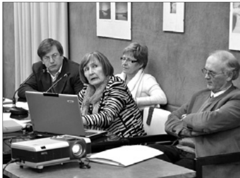
Trije predavatelji z voditeljem ponedeljkovega večera