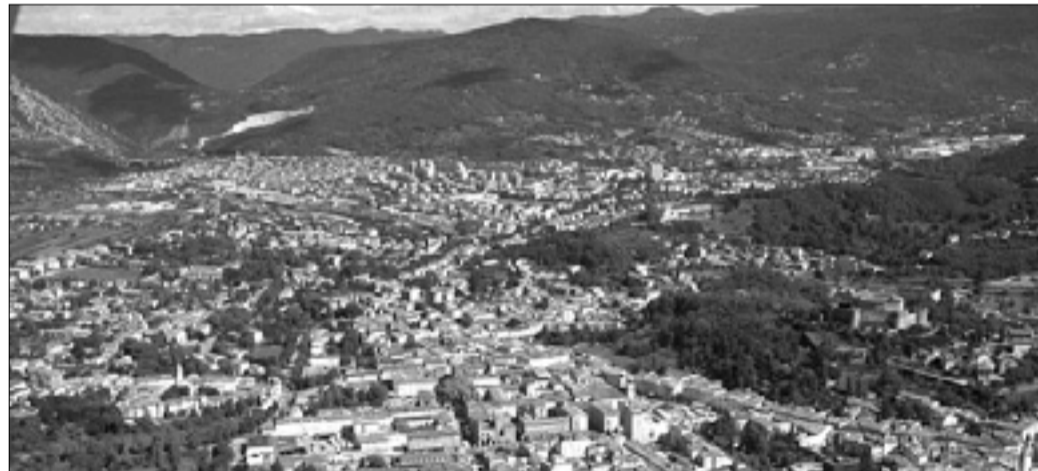
Čezmejni prostor bo s projektom GoEurocampusGo postal zanimiv tudi za študente iz drugih evropskih držav

Med mestoma bo zgrajeno enotno brezžično omrežje WiFi, ustanovljen internetni portal in vzpostavljena enotna študentska kartica