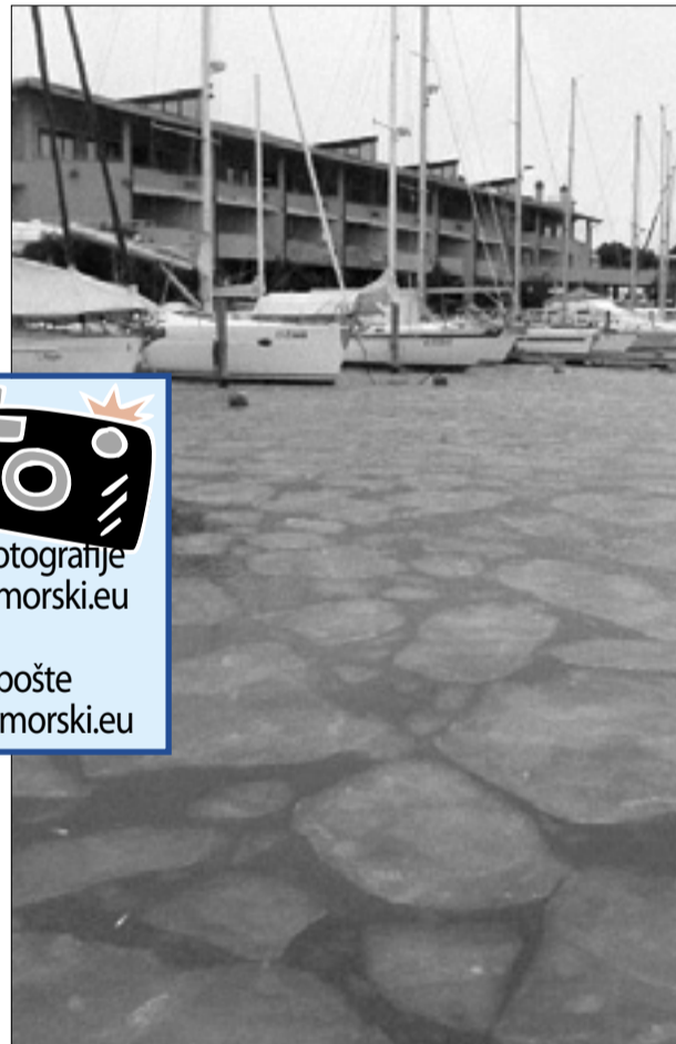
Led sredi gradeških navtičnih privezov

Burja & sneg Pošlji svoje fotografije na www.primorski.eu ali na naslov elektronske pošte tiskarna@primorski.eu