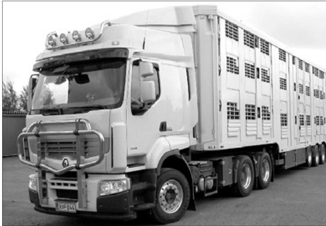
Tovornjak za prevoz živali

Goriški prometni policisti sodelujejo pri nadzoru nad prevozom živali z osebjem zdravstvenega podjetja, s katerimi preverjajo, da šoferji spoštujejo vse omenjene zakonske predpise.