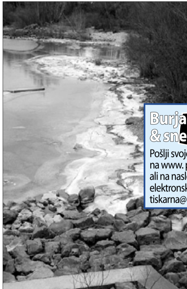
Zamrznjena Soča pri Podgori

Burja na Ajdovskem odkrila vsaj sto stavb - V glavnem gre za nove ali pred kratkim obnovljene objekte