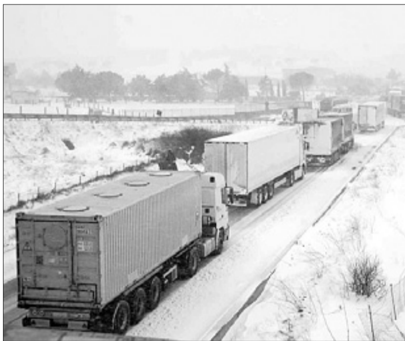
Ustavljene tovornjaki zaradi snega