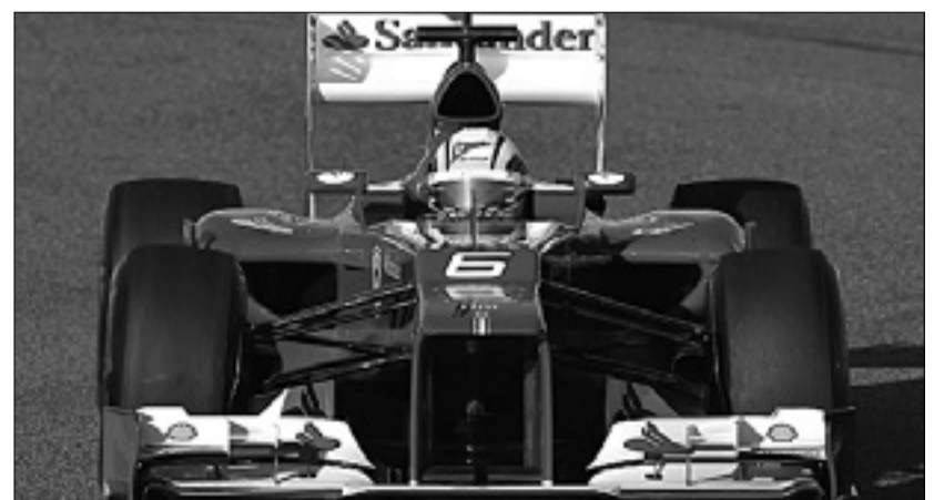
Felipe Massa in novi Ferrari