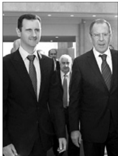
Bašar al Asad in Sergej Lavrov

Lavrov je še dejal, da je Moskva pripravljena sodelovati pri iskanju rešitve, ki bi temeljila na načrtu Arabske lige. Ta predvideva, da bi al Asad oblast predal podpredsedniku države. Rusi-