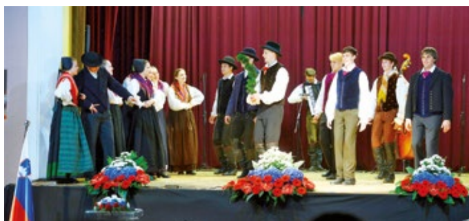
Mladinska folklorna skupina Mengeš