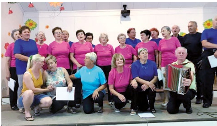
Nastop v domu starostnikov Kamnik

Enkrat letno se člani DU s turistično agencijo odpravimo na dvodnevni izlet v tujino. Tokrat smo se 1. junija odpeljali proti Budimpešti po štajerski avtocesti preko Prekmurja, ob južni obali Blatnega jezera, mimo letovišča Siofok do Budimpešte. Odpeljali smo se na Gerhardov hrib, kjer se s Citadele, trdnjave iz 19. stoletja, razprostre čudovit razgled na mesto. Ogledali smo si tudi Pešto z mogočnimi palačami, muzeji, slovitimi kavarnami, kopališči in gledališči. Naslednji dan smo se popeljali po zahodnem delu