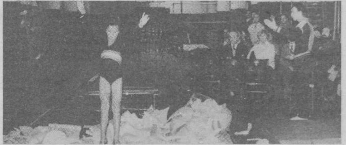
Doskok v posebno jama