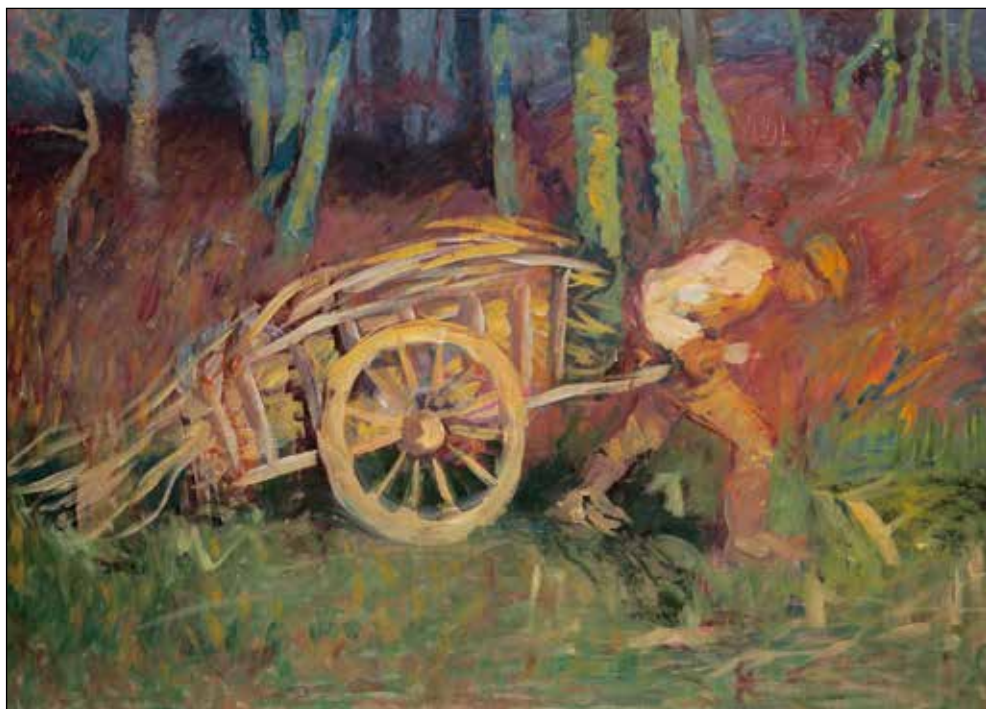
Ivan Grohar, Mož z vozom (tudi: Koruza, Voznik ), (1910); olje/platno, 93,5 x 131 cm; Moderna galerija, Ljubljana.