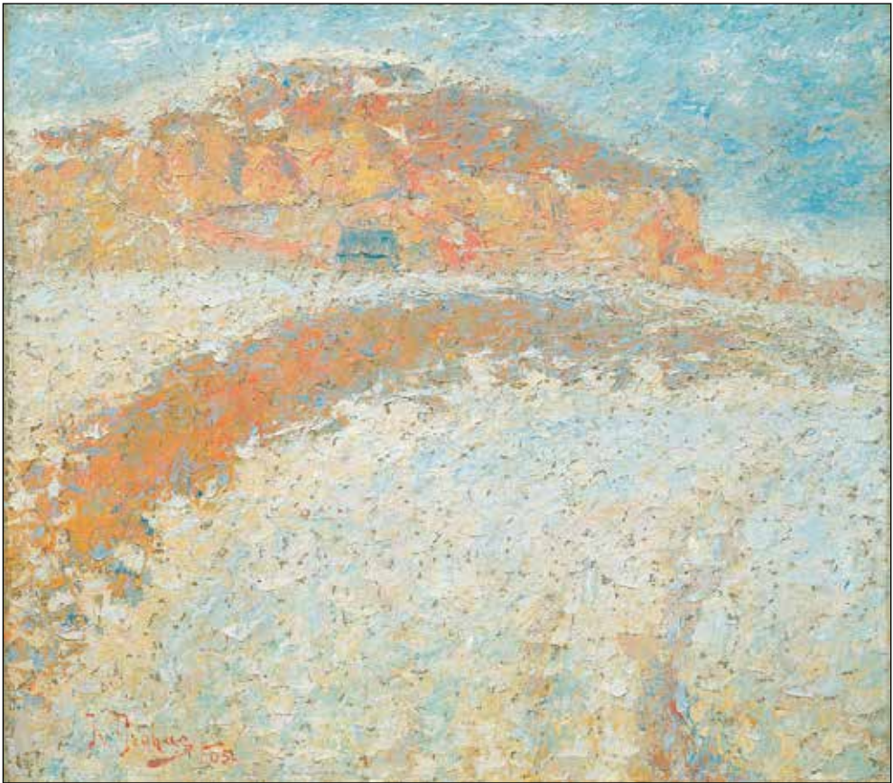
Ivan Grohar, Kamnitnik (tudi: Zasneženi Kamnitnik ), 1905; olje/platno, 87,4 x 99,5 cm; Narodna galerija, Ljubljana.