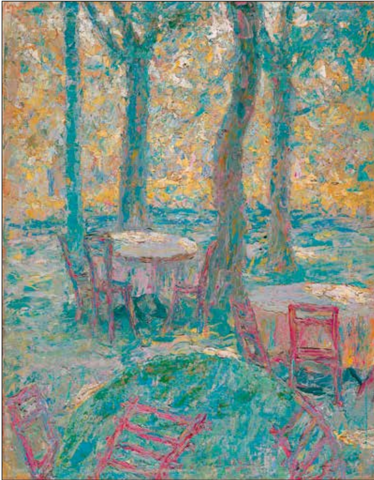
Ivan Grohar: Štemarski vrt (tudi: Vrt v Štemarjih ), 1907; olje/platno, 55 x 44 cm; Narodna galerija, Ljubljana.