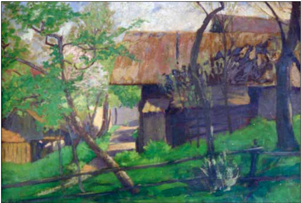
Ivan Grohar, Kmečka hiša , (1901); olje/platno, 54 x 80 cm; Muzej in galerije mesta Ljubljane.