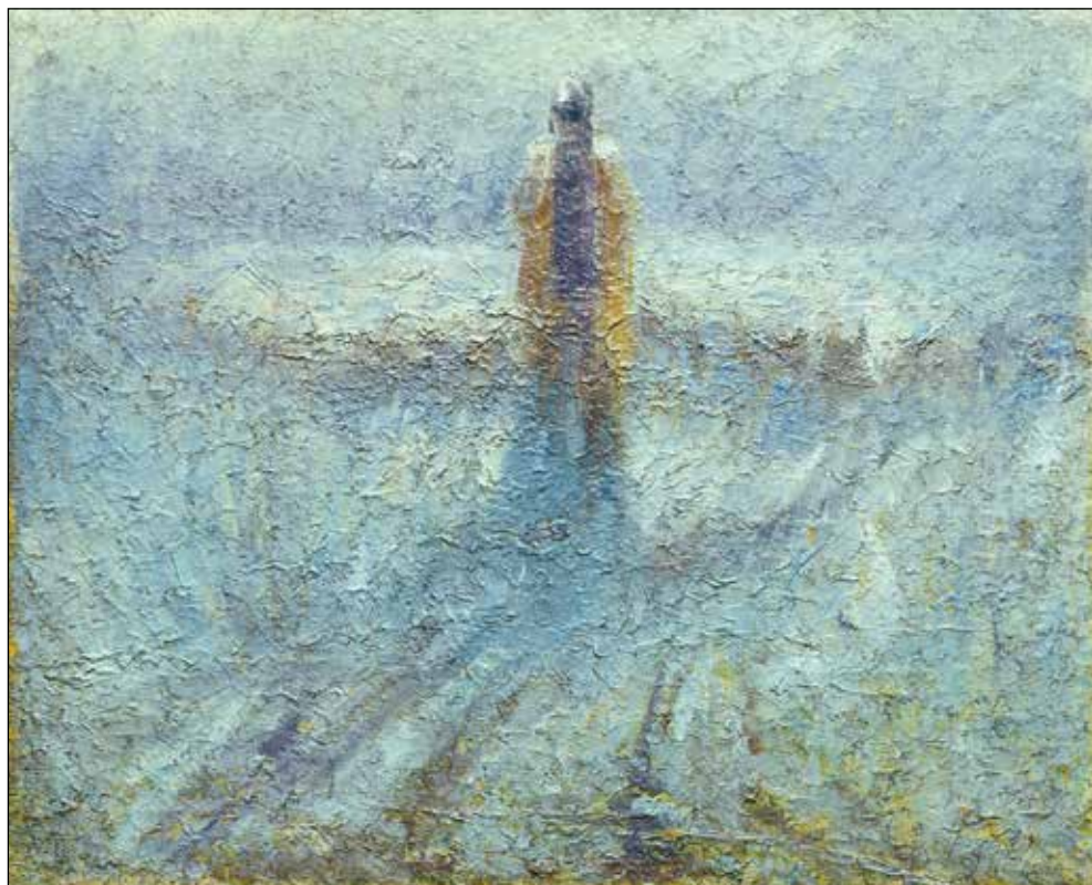
Ivan Grohar, Črednik (tudi: Pastir ), (1910); olje/platno, 73,5 x 85,5 cm; Moderna galerija, Ljubljana.