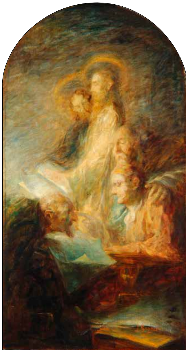
Ivan Grohar, Sv. Ciril in Metod , 1906/1907; olje/platno, 162,5 x 85 cm; Narodna galerija, Ljubljana.